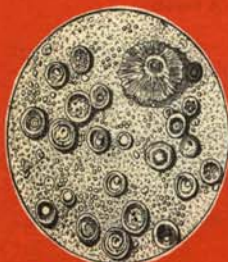
PASEO DEL PRADO

Ofrecemos unas vistas panorámicas recién observadas del aire que respiramos en la sufrida capital de España, cima por ahora de las contaminaciones nacionales.