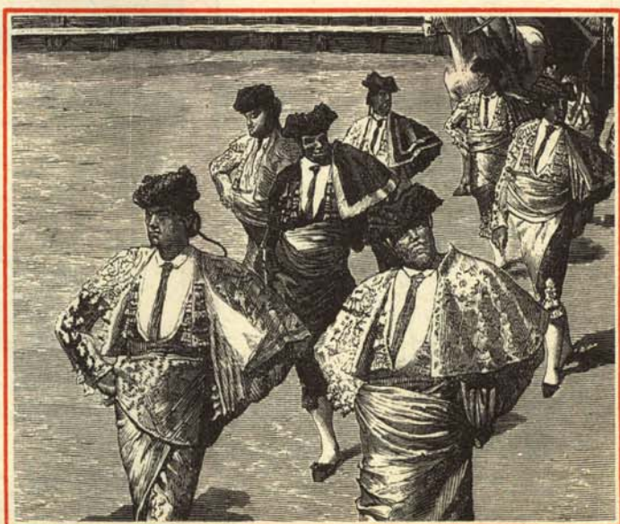
—Mira, aquel bajito de la derecha es el de los impuestos.