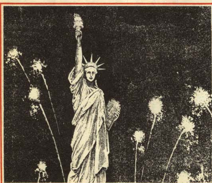
—Como se me arrime alguien que quiera ser libre, le arreo un antorchazo.