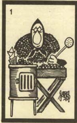
( Castanearia caldeans senecta. )