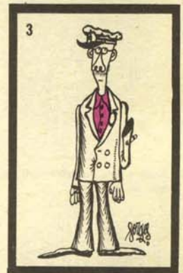
( Portaapperiens mutilatus. )

diar fácilmente los límites de las sucesivas glaciaciones e interglaciaciones, compartiendo su ámbito con el reno. Localizables fácilmente por su fuego característico ( focus castanearius ) su nú-