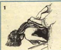
1 Posible futuro alcohólico.

El consumo de alcoholes fuertes bebidos en ayunas para matar el gusanillo venía causando estragos en la salud pública nacional. Gracias a los avances de la Medicina moderna, desde ahora el gusanillo podrá ser extraído quirúrgicamente de una vez para siempre: