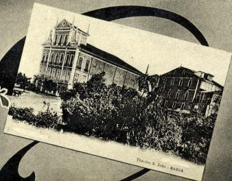
Teatro S. João - BAHIA