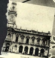
Câmara Municipal - BAHIA