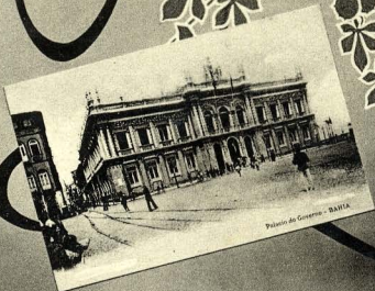
Palácio do Governo - BAHIA