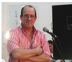
Silvio Rodríguez: Al alba venid, buen amigo