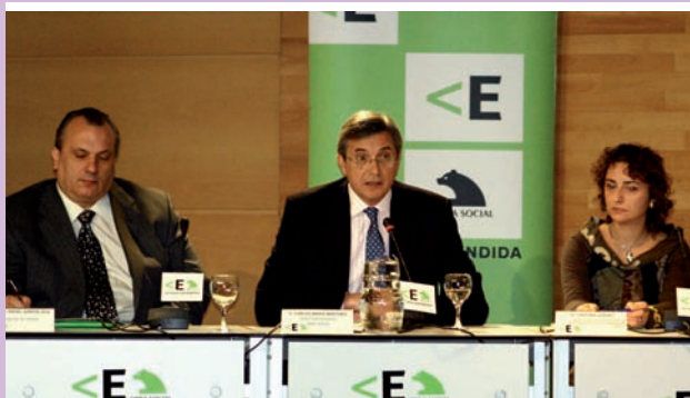
Acto de Presentación del Libro