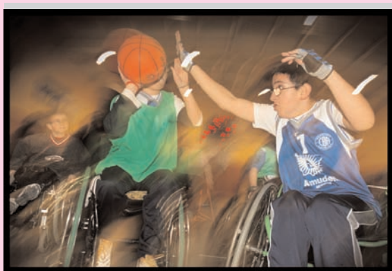
Segundo Premio: "Basket". Autor: Javier Arcenillas