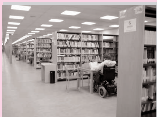
Mención Unviersidad y Discapacidad: "Clavando los codos". Autora: Amaia Mejía