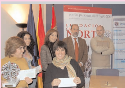
Acto de Entrega de Premios