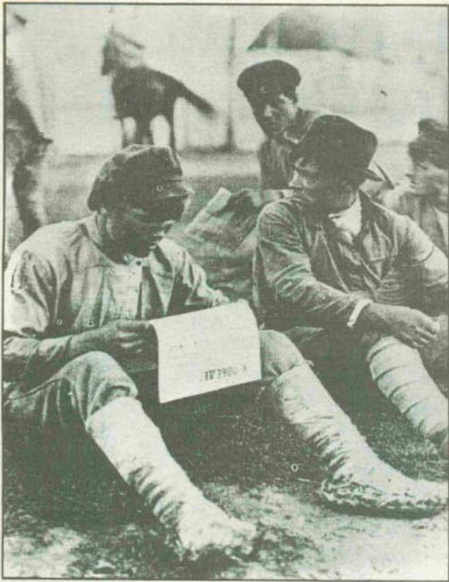
La primera peculiaridad del proceso ruso consiste en tener que aplicar a una sociedad subdesarrollada y con fuerte predominio agrícola unos esquemas que habían sido elaborados para una colectividad —como Inglaterra— de mucho mayor desarrollo capitalista. (Las imágenes muestran el éxodo campesino de 1917 y el descanso de unos soldados revolucionarios.)

clase obrera, eso ya es socialismo (en esta línea, el desconocimiento del marxismo que le era manifiesto, le lleva a no alcanzar la distinción, muy clara en Marx, entre propiedad jurídica y propiedad real). Por otro lado y para impedir la oposición a su planteamiento, a partir de la muerte de Lenin se canoniza a éste por medio de dos mecanismos: uno, impidiendo cualquier crítica, extremo que no se había dado en vida de aquél ya que las discrepancias habían sido numerosas; y otro, aprovechando una selección de textos de la amplia producción literaria de Lenin quien, como buen marxista, había ido adaptando la teoría a la realidad cambiante que se había impuesto en cada momento. A partir de Stalin, se invierte el proceso: la realidad habrá que adaptarla a la teoría. Así, en la polémica con Trotsky, el único capaz de haber cambiado el rumbo de los acontecimientos Stalin se arrogará la auténtica interpretación del nuevo marxismo-leninismo, acusándole de representar intereses aparentemente ultraizquierdistas pero realmente pequeño-burgueses.