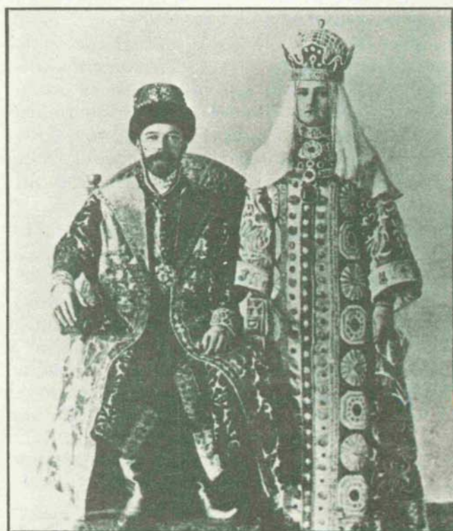
Para entender plenamente el significado de la Revolución de Octubre, es preciso arrancar de la realidad sociopolítica de la Rusia zarista, caracterizada por la más brutal de las injusticias y por una total diferencia de clases. (En la foto, Nicolás II y la zarina.)

No obstante, aquí radica el auténtico problema no sólo para la URSS, sino para toda la izquierda marxista, sobre todo europea. ¿El nuevo Estado es un Estado socialista? Para Sotelo parece claro que no, pero también está claro que no es un Estado capitalista. Si, como el autor señala, lo que se da no es socialismo, habrá que preguntarse si es un régimen de