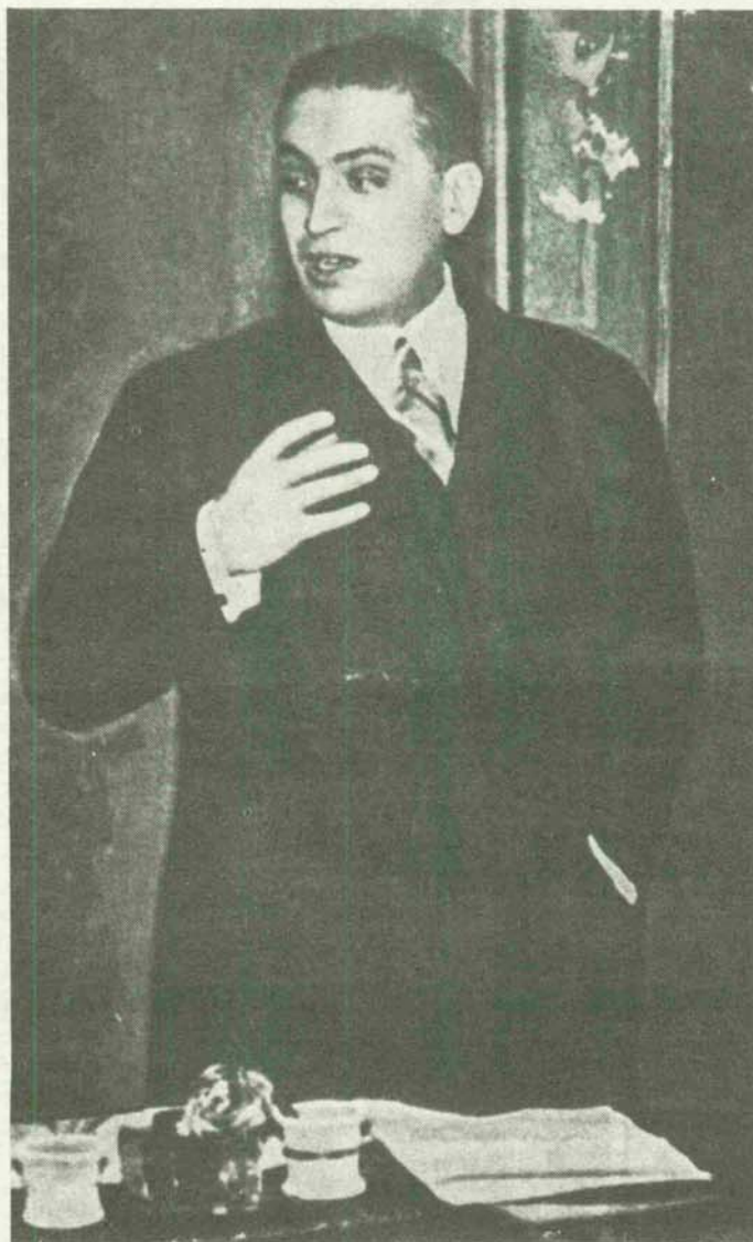
(«La Vanguardia Española», 13-VII-1946.)

des particulares cuya unidad engarzada constituye la verdad absoluta de España ante Dios y ante la Historia. Pues una de semejantes verdades es que Calvo Sotelo, jefe de la oposición parlamentaria en unas Cortes que se decían representativas de la libertad y de la democracia, fue asesinado por orden expresa del Gobierno de la República, del que, por cierto, formaba parte ese malvado zascandil que ahora, mediante el oro robado a España, levanta los tinglados de la propaganda contra nuestro país y se arrastra en las antesalas de la O.N.U. en la porfía villana de negarle al Estado español la limpieza de su origen, que no es otro que la lógica del Alzamiento. Calvo Sotelo encarnada en el Congreso de los Diputados la encendida y trémula razón de los españoles que se sentían vilipendiados en su honor y arriesgados en su vida bajo la férula del Gobierno republicano. De la realidad del peligro que todas las tardes —en aquellos dos meses de jornadas parlamentarias transidas, no de pasión, porque la pasión es humana, sino de ulular de fieras— denunciaba el gran tribuno monárquico, había de dar fe en la madrugada del 13 de julio su propia in-