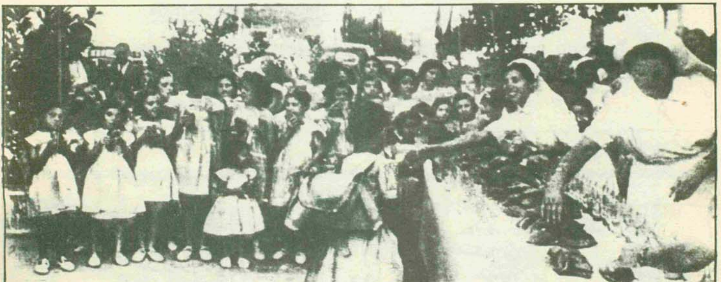
MADRID. —Han salido de esta capital para Guadarrama, Santoña y La Sabinosa (Tarragona) nuevas colonias infantiles, organizadas por el Patronato Nacional Antituberculoso. Antes de la partida, los 500 niños que forman las tres expediciones fueron obsequiados, en la plaza de España, con una merienda, ofrecida por las autoridades.