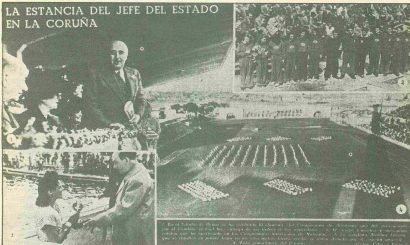
(«La Vanguardia», 6-IX-1946.)