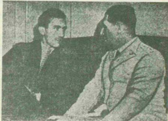
El Presidente de la República Argentina, general Perón, conversando con el autor de este artículo

Era exactamente el 20 de febrero de 1944, mes que en las latitudes americanas los campos y las montañas están cubiertos de flores, cuando tomé el avión que me conduciría de Santiago de Chile a Buenos Aires para informar a la opinión pública chilena, a través de la cadena de diarios que representaba, cuáles eran las causas de la revolución del 4 de junio de 1943. Hacía tiempo que se venía hablando en todo el Continente del coronel Perón, que hacía varios meses que había llegado a su país, después de un largo viaje por Europa estudiando, en representación del Ejército, los problemas económicos, políticos, sociales y militares del Viejo Continente. Se decía que este militar, que ocupaba la jefatura del ministerio de la Guerra, era el alma y nervio de una institución que él creó con el nombre de C. O. E. (Grupo de Ofi-