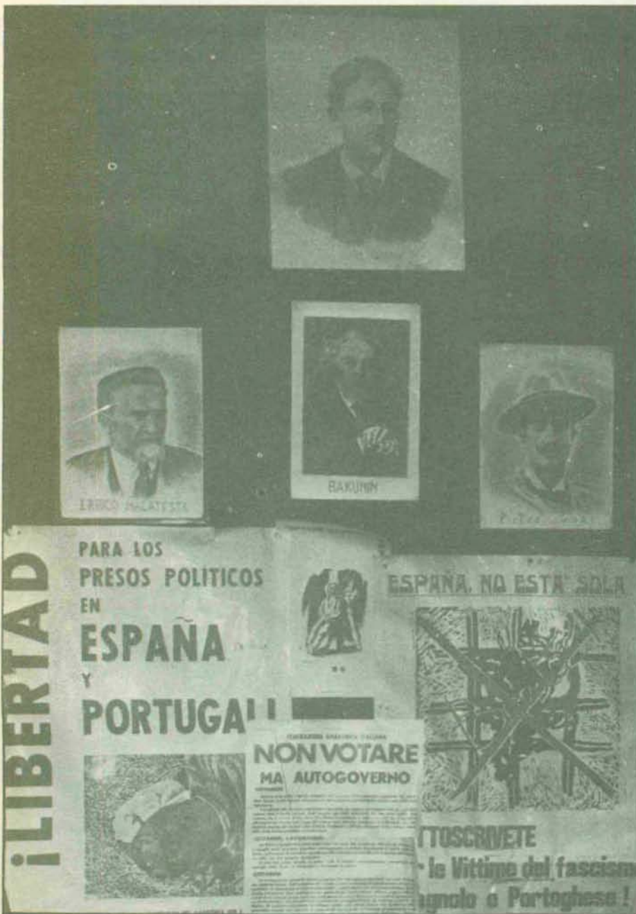
«Cuando todo fracase, cuando se demuestre que son ineficaces para resolver los problemas de la humanidad las diferentes formas de Estado, lo que quedará es lo nuestro, todo lo que han sido las constantes del anarquismo. Junto a estas líneas, retratos de algunas de las grandes figuras anarquistas.

—F. M.: Volvemos a lo mismo: hay que comprender la situación de aquellos días. La economía estaba en brazos de los trabajadores, pero para poder funcionar las fábricas se necesitaban materias primas, y para adquirir estas materias primas se necesitaba dinero. ¿Quién tenía el dinero? El Gobierno central. Por otra parte, en el frente estaban nuestros hombres, pero las armas venían de Rusia, y era el Gobierno quien las distribuía. Si nosotros nos hubiéramos replegado totalmente, las colectividades se hubieran asfixiado y nuestras Divisiones hubieran sido asesinadas en el frente, porque ya no tenían armas para defenderse, pues se las iban negando. Además, un repliegue general de los nuestros era el fin de la guerra, en esto mi convicción es absoluta. También se pensó que había que evitar que los otros, a nuestras espaldas, pactasen con Franco. Por todo esto se entró en el Gobierno. Claro, ahora se puede decir que, quizá sólo retardamos un poco lo que ya estaba perdido. Hoy, fríamente, digo que nuestra entrada en el Gobierno no fue compensada; ojalá no hubiéramos intervenido y no nos hubiéramos encontrado, histórica e ideológicamente, deshonrados. Nadie, en aquel momento, podía pensar de esa manera, pues hubiese sido calificado de derrotista y contrarrevolucionario. Esa fue la realidad de las cosas.