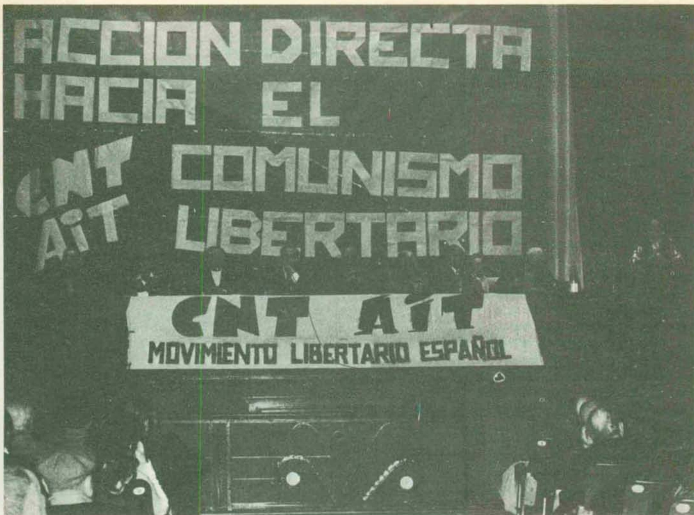
Durante su exilio en Francia, Federica Montseny, a la que vemos a la derecha de la foto pronunciando una conferencia, siguió vinculada a la organización anarco-sindicalista, que pasa a llamarse entonces CNT de España en el Exilio.

—C. F.: ¿Cómo fue tu paso por la CNT, hasta julio del 36? ¿Cuál era tu función?