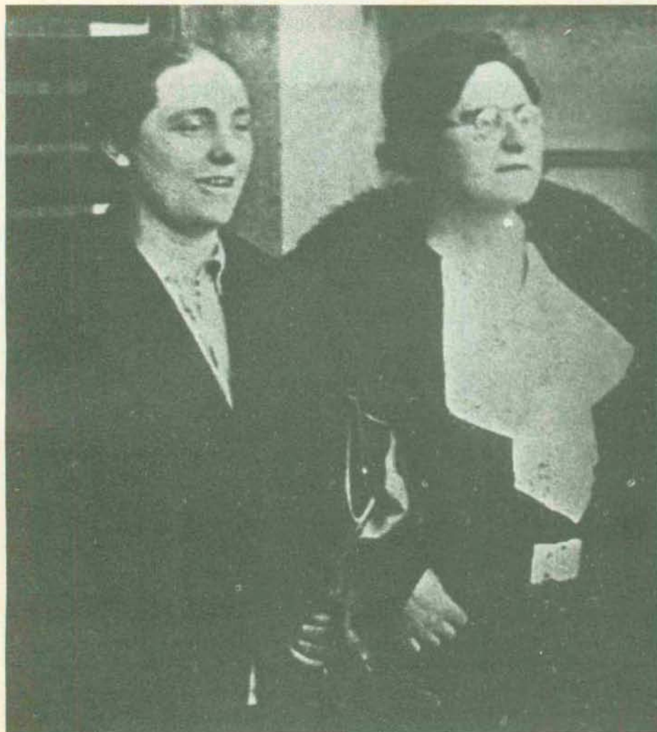
«La guerra no se perdió mientras el pueblo mantuvo la esperanza de que lo que se estaba librando era una guerra social, que iba a una transformación de la sociedad, a distribuir más pan, más justicia y más libertad a los hombres». En la foto, Isabel Blume, diputada socialista belga, con la anarquista catalana.

íbamos poco a poco avanzando hacia la derecha, que vendría el fascismo, como éste no estaba todavía allí, no había algo concreto, como el levantamiento del 18 de julio, contra lo que responder.