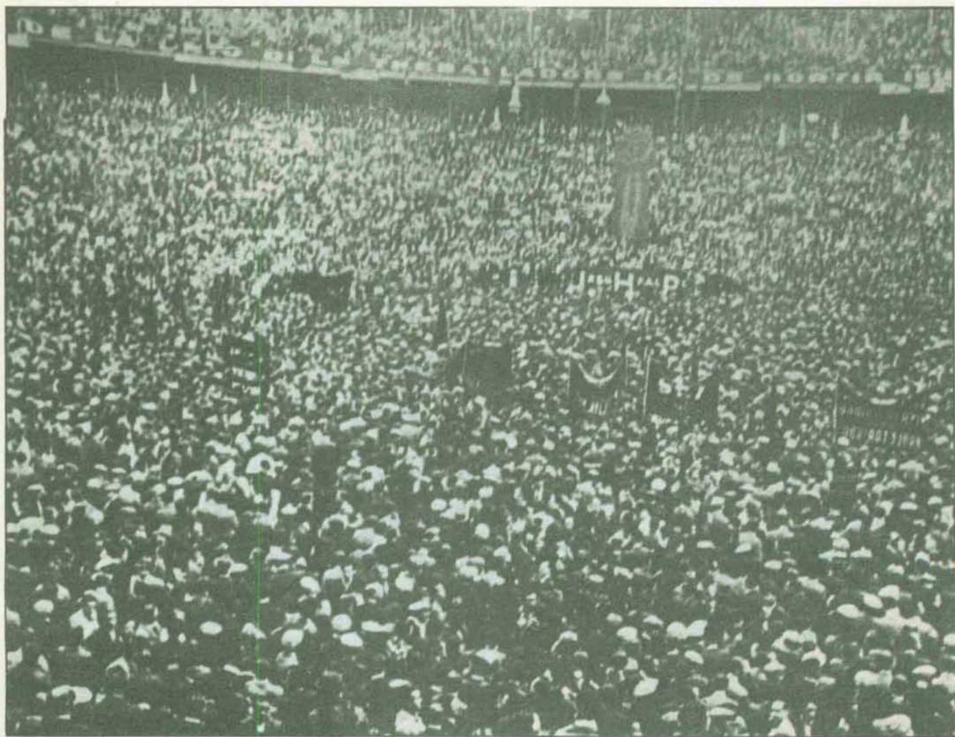
Durante el advenimiento de la Segunda República las organizaciones libertarias se fueron incrementando de forma masiva. Como la CNT estaba libre de todo compromiso la gente iba a ella porque se sentía mejor interpretada y defendida. Sobre estas líneas, una concentración de afiliados a la Confederación Nacional del Trabajo en Barcelona, el 25 de octubre de 1936.

—F. M.: La República fue bien acogida por todos, pero se cifraron en ella muchas más esperanzas de las que podía sustentar. La gente esperaba una República federal, y no centralista; una República social, con realizaciones económicas avanzadas, con expropiaciones de tierras para acabar con el latifundio, con facilidades a las cooperativas y a los sindicatos agrícolas; o en el aspecto industrial, avances de tipo tecnológico y social, que la República no hizo. No hizo porque no pudo, porque no quiso, porque no se le dejó