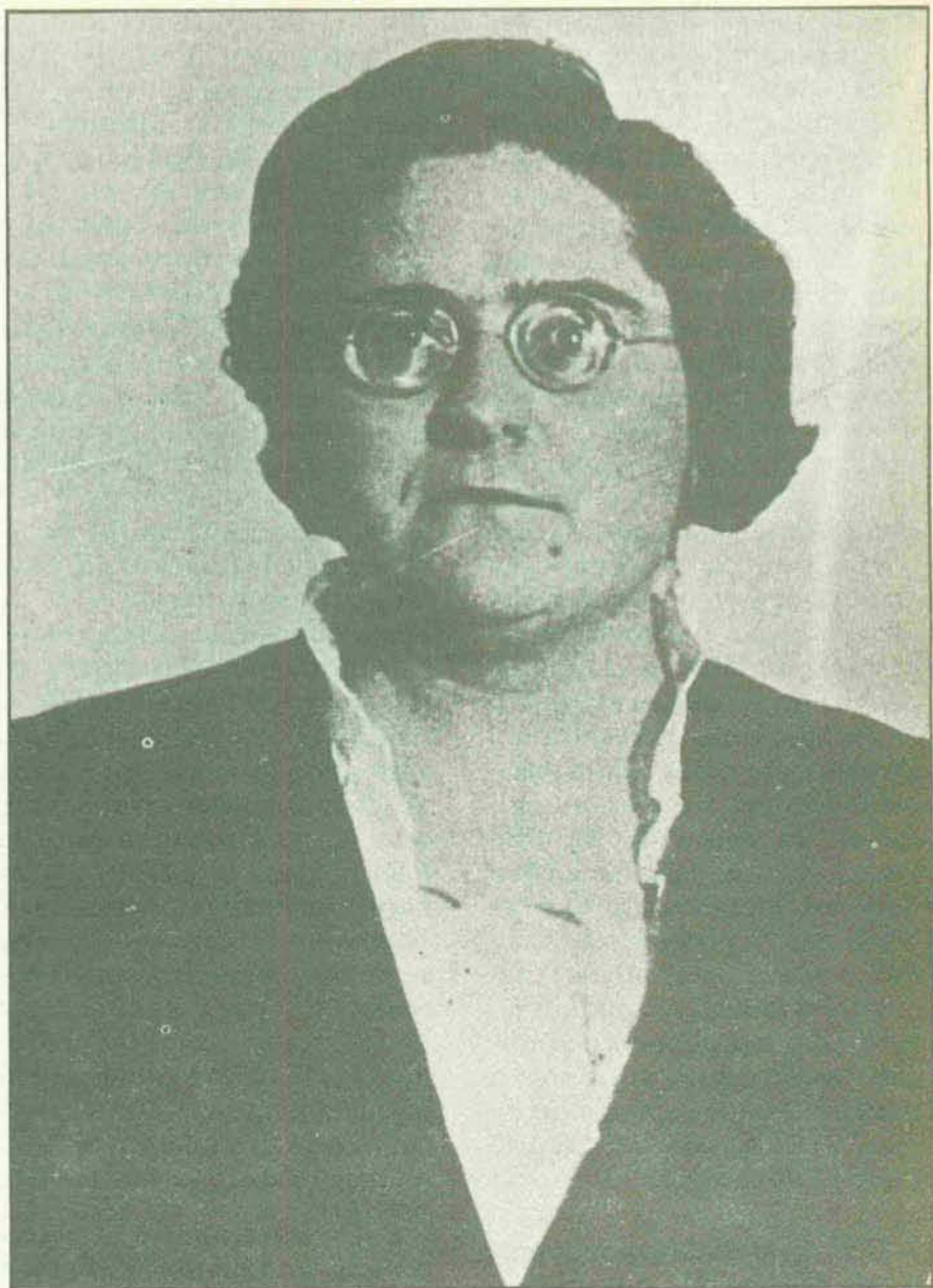
Genetista desde los 18 años, anarquista desde siempre, Federica Montseny ha sido la única mujer que ha ocupado una cartera ministerial (la de Salud Pública) en un gobierno español.

— F. M.: Precisamente éste es uno de los grandes debates que ahora hay entre compañeros en España. Las relaciones CNT-FAI siempre fueron buenas, y más después del 18 de julio del 36, pero no confundamos nunca entre lo que son relaciones de organización a organización, como lo fueron con la F. I. J. L. (Federación Ibérica de Juventudes Libertarias), y la creencia de que la