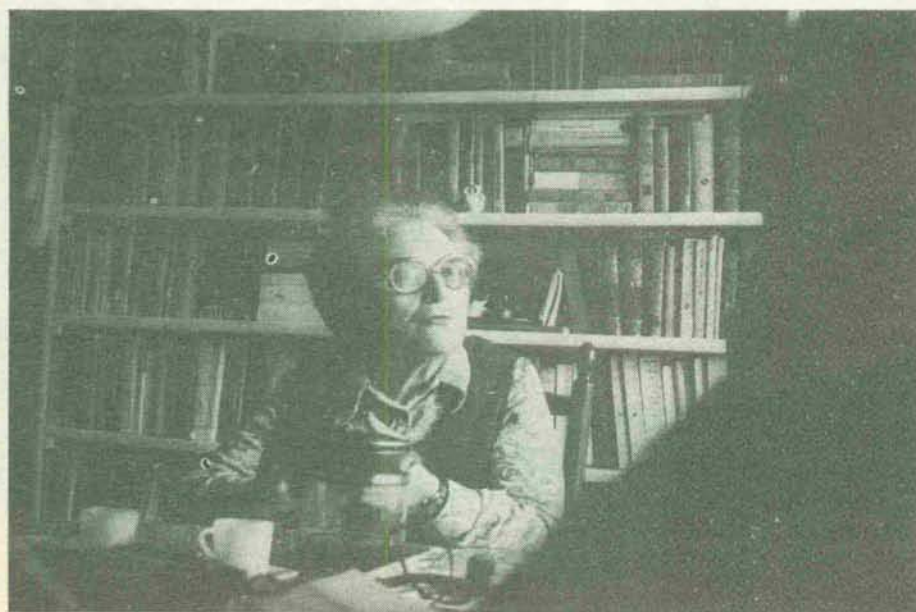
«Optimista lo he sido siempre, incluso en los años más negros de la dictadura. Y hoy lo soy más que nunca».

lidades históricas, en España y en el mundo.