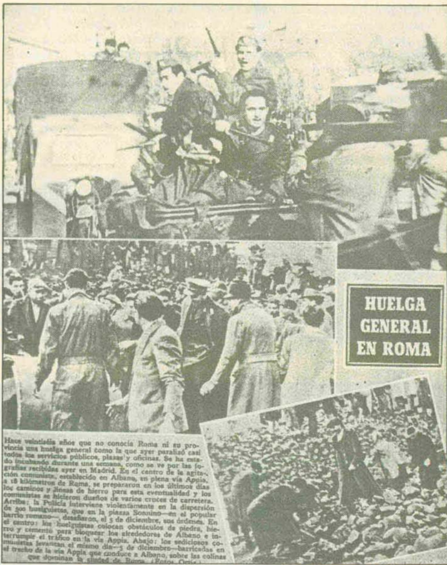
Hace veintidós años que no conocía Roma ni su provincia una huelga general como la que ayer paralizó casi todos los servicios públicos, plazas y oficinas. Se ha estado incubando durante una semana, como se ve por las fotografías recibidas ayer en Madrid. En el centro de la agitación comunista, establecido en Albano, en plena vía Appia, a 18 kilómetros de Roma, se prepararon en los últimos días los camiones y líneas de hierro para esta eventualidad y los comunistas se hicieron dueños de varios cruces de carretera. Arriba: la Policía interviene violentamente en la dispersión de 300 huelguistas que en la plaza Scarsini—en el popular barrio romano— desafiaron, el 5 de diciembre, sus órdenes. En el centro: los huelguistas colocan obstáculos de piedras, hierro y cemento para bloquear los alrededores de Albano e interrumpir el tráfico en la vía Appia. Abajo: los sediciosos comunistas levantan el mismo día—5 de diciembre—barricadas en el trazo de la vía Appia que conduce a Albano, sobre las colinas que dominan la ciudad de Roma.