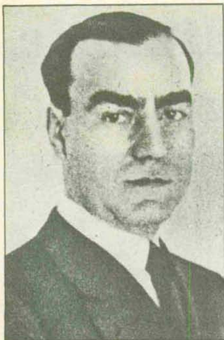
El Excmo. Sr. D. Luis Carrero Blanco, autor de la obra «La victoria del Cristo de Lepanto», que ha obtenido el premio Nacional de Literatura «José Antonio Primo de Rivera», otorgado anualmente por la Dirección General de Propaganda.