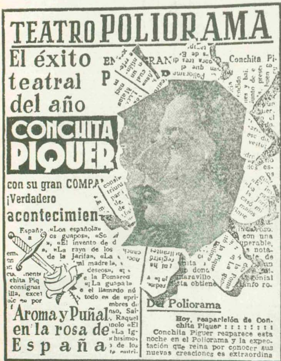
(Publicidad insertada en los diarios barceloneses del 10-XII-1947.)

La inflación monetaria está íntimamente relacionada con la holgazanería y la pereza colectivas. Está ya todo el mundo viendo claramente que socialismo, inflación y holgazanería es todo uno y lo mismo que una de las causas de la depreciación monetaria se debe a que la gente trabaja hoy muchísimo menos que años atrás, en todos los terrenos. Se dirá: la gente trabaja menos, porque come menos. Lo cual es exactísimo. Replicaré, sin embargo, cuanto menos trabaje, más escasos serán los alimentos. Cosa también infalible. Si la producción y la distribución de mercancías cuesta hoy muchísimo más que treinta años atrás, ello equivale a decir que para producir y distribuir esas mercancías son necesarios muchos más billetes. Si para producir una mercancía cualquiera se necesitaban antes dos obreros y ahora, para hacer lo mismo en el mismo tiempo, se necesitan cuatro, se tendrá que do-