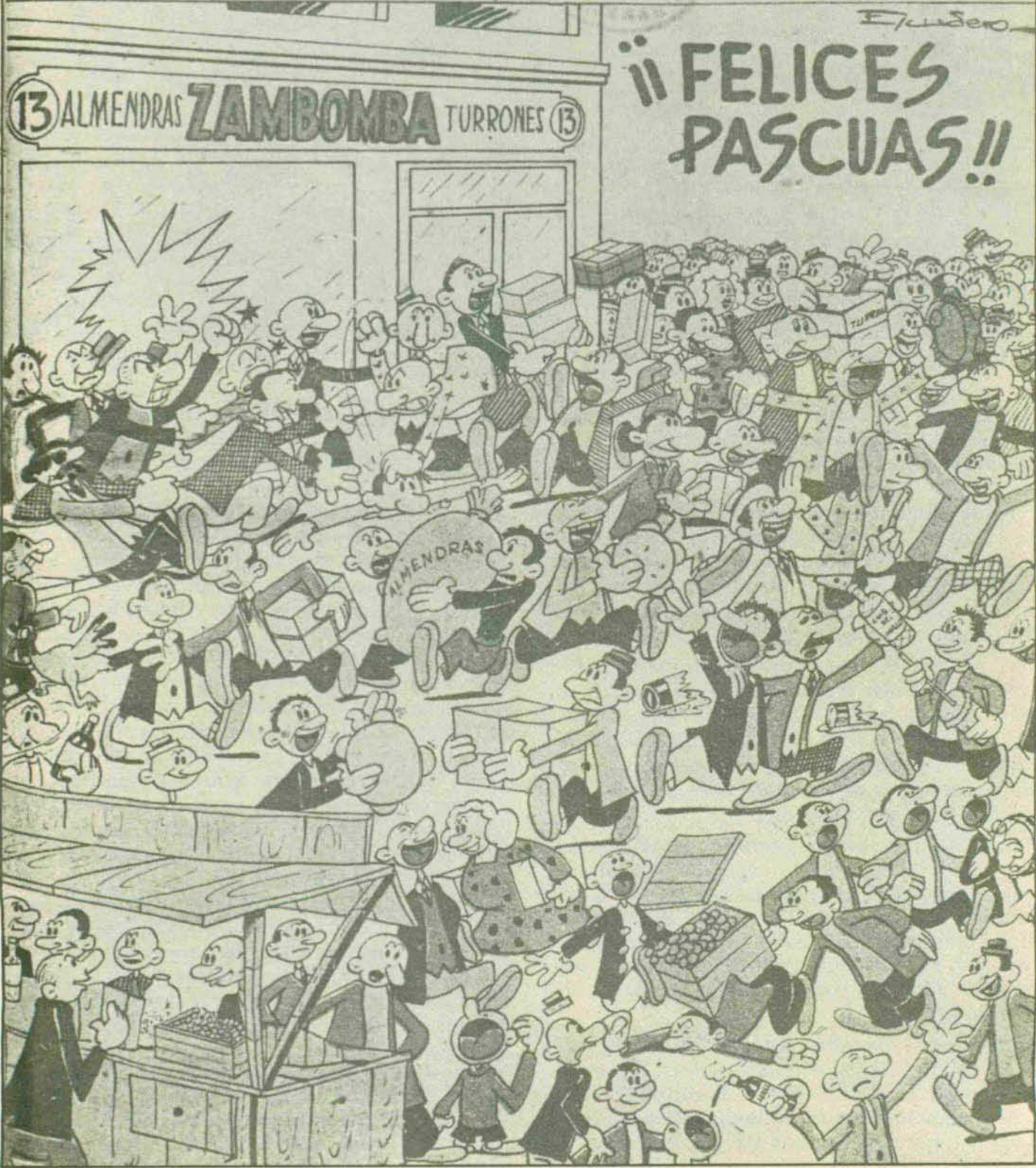
(«Flechas y Pelayos», número 467, de 28-XII-1947.)