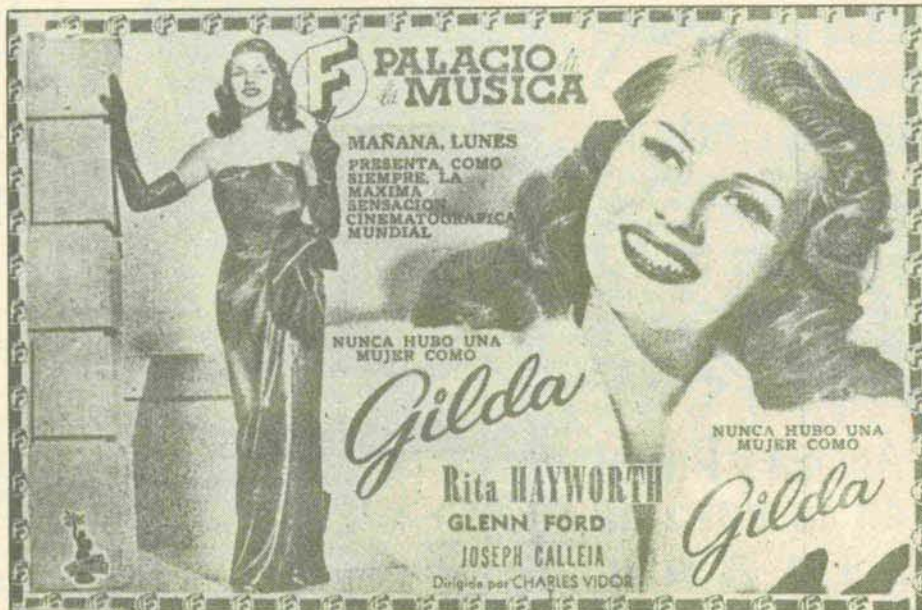
(Publicidad insertada en los diarios madrileños del 21-XII-1947.)

(«Signo», Semanario de Acción Católica, número 415, de 27-XII-1947.)