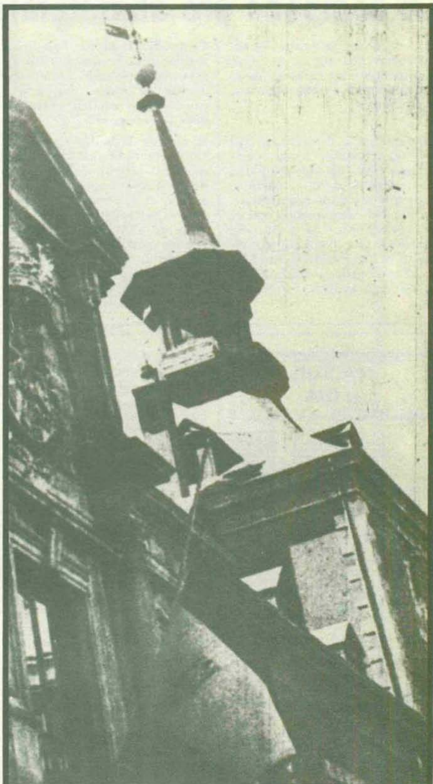
DUELO ESPAÑOL POR LA MUERTE DEL MARISCAL CARMONA.—En señal del duelo nacional, la bandera de España ondea a media asta en el Ministerio de Asuntos Exteriores.