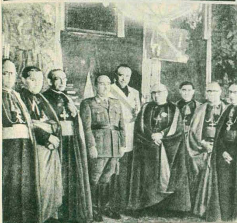
Ante el Caudillo prestaron juramento, que les fue tomado por el ministro de Justicia, el arzobispo de Tarragona y los obispos de León, Zamora, Oviedo, Teruel-Albarracín, Sigüenza y Tuy. Los preladados aparecen en la fotografía con S. E. el Jefe del Estado y don Eduardo Aunós. ("ABC", 10-X-1944.)