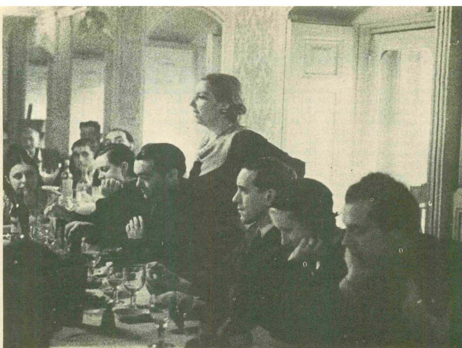
«SURGIO ANTE MI, RUBIA, HERMOSA, SOLIDA Y LEVANTADA, COMO LA OLA QUE UNA MAR IMPREVISTA ME ARROJARA DE UN GOLPE CONTRA EL PECHO». ASI DESCRIBE RAFAEL ALBERTI SU ENCUENTRO CON MARIA TERESA LEON, A QUIEN VEMOS (DE PIE) EN UN BANQUETE A ELLA DEDICADO EN FEBRERO DE 1936. A SU DERECHA, GARCIA LORCA; EL ULTIMO A SU IZQUIERDA, RAFAEL ALBERTI.

curado la adhesión: Alcalá Zamora, Fernando de los Ríos, Largo Caballero... Unamuno envió desde Salamanca un telegrama que, reservado para el final, hizo poner de pie a la sala, volcándola, luego, enardecida, en las calles. Cuando acudió la policía ya era tarde. El teatro estaba vacío. Sólo quedaba, arrumbado entre los bastidores, el carrusel de los hombres deshabitados, que en mi obra representaban todos los seres sin vida, esos trajes huecos, sin nadie, que doblan las esquinas del mundo, estorbando el paso de los demás.