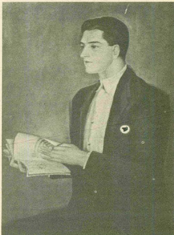
ALBERTI, JOVEN, POR GREGORIO PRIETO.