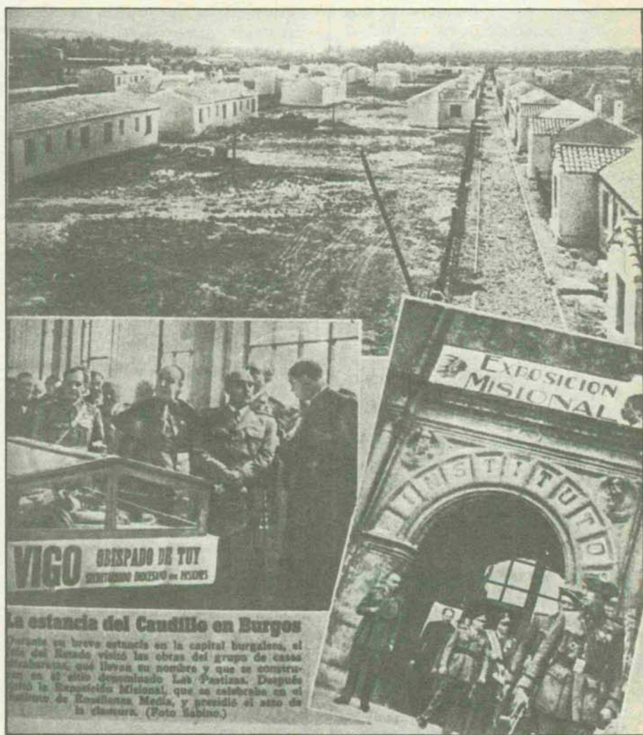
La estancia del Caudillo en Burgos

chos.» Aludió a la práctica de los sistemas materialistas que acaban, como en Rusia, prohibiendo al obrero hasta el derecho más elemental de elegir la clase y el lugar del trabajo, y donde media Rusia espía a la otra media, habiendo desaparecido todo concepto del derecho, de la libertad y de la justicia social. El Caudillo terminó sus palabras exhortando a todos los obreros a la más estrecha unión, y advirtiéndolo-