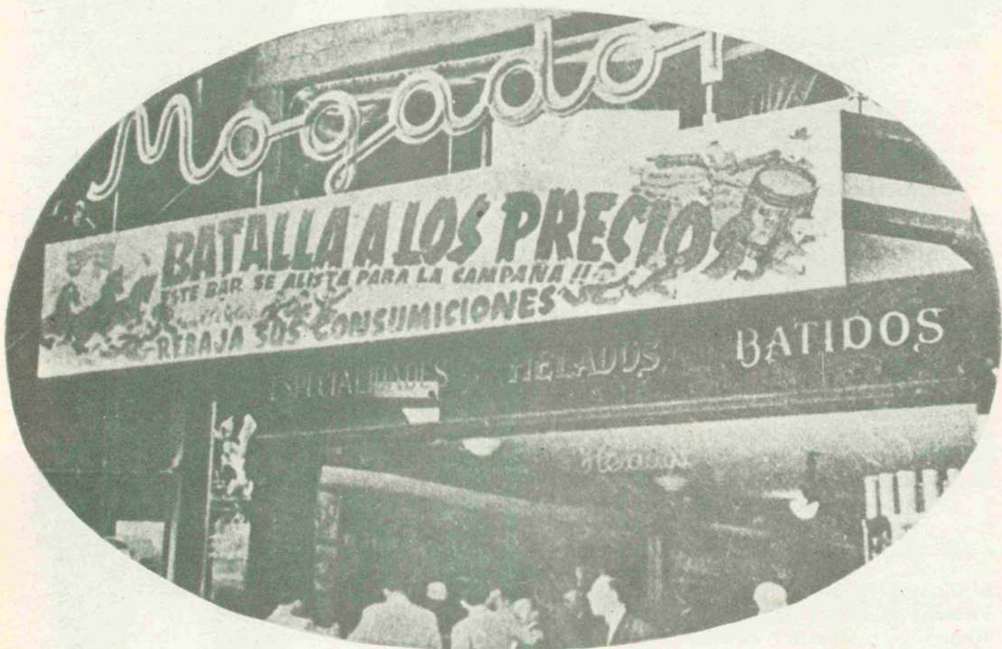
(«Diario de Barcelona», 30-VIII-1946.)

las juventudes más generosas, las juventudes más magníficas que el mundo nos admira... (Una voz interrumpe: «¡Porque tenemos el mejor capitán!». Una clamorosa ovación acoge las últimas palabras del Caudillo.) Pero no olvidéis que no hay nunca capitán sin soldados. Muchas de las cosas que vosotros le asignáis al capitán, cuántas veces son gloria de sus soldados, más de lo que os imagináis. Por eso os digo que hay que organizar la juventud, educarla, y para ello es necesario la colabora-