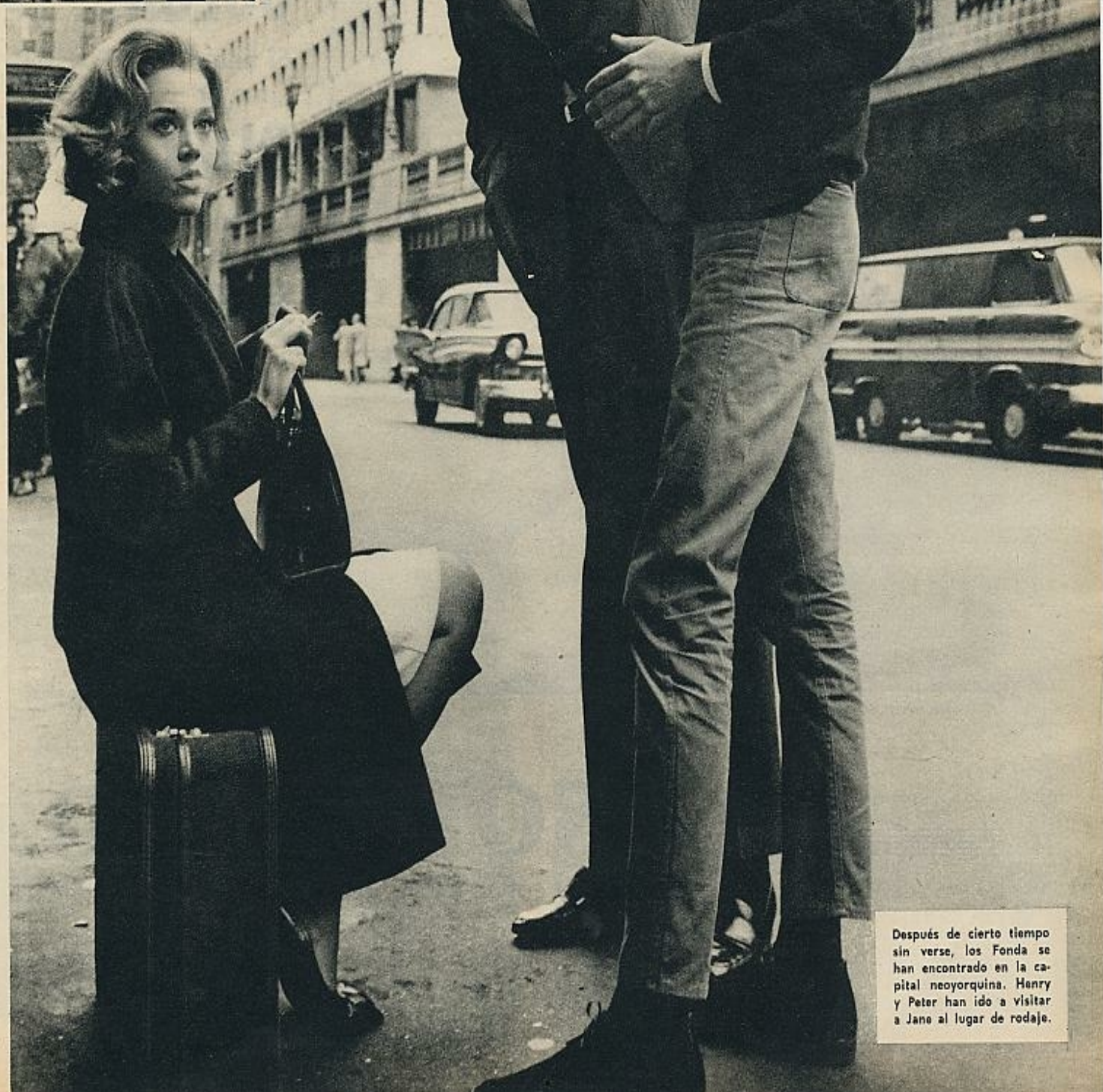
Después de cierto tiempo sin verse, los Fonda se han encontrado en la capital neoyorquina. Henry y Peter han ido a visitar a Jane al lugar de rodaje.