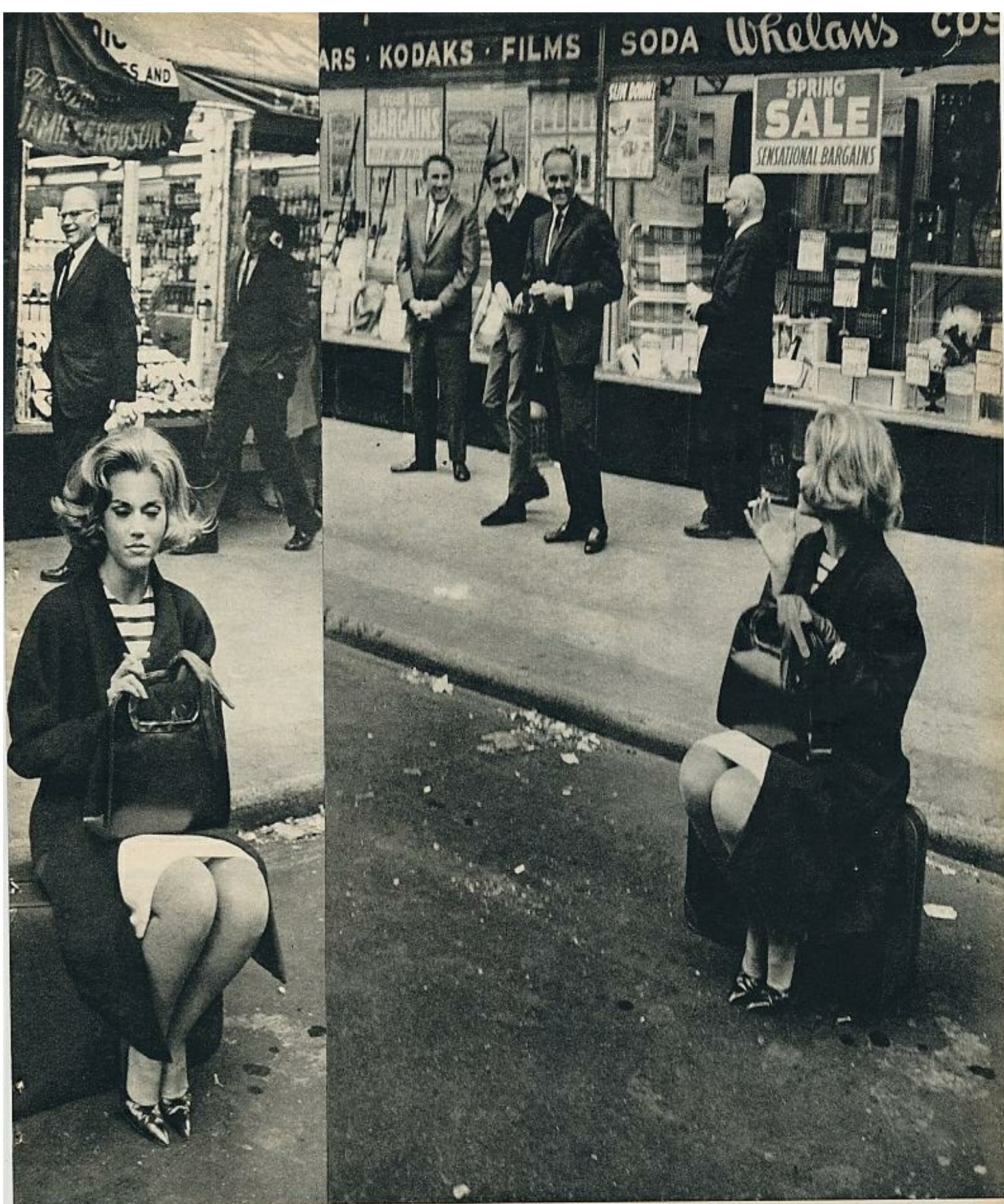
y su hermano han ido a hacerla una visita al lugar donde se encuentra rodando, y mientras se prepara un plano improvisan esa pantomima para divertirla...