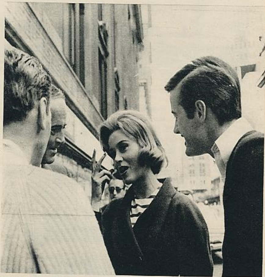
Jane Fonda tiene veinticuatro años. Fue protagonista, junto a Tony Perkins, de «Me casaré contigo».

L A familia se ha encontrado donde tenía que encontrarse: en el trabajo. Hacía tiempo que no se veían. Porque el cine es una profesión que desune las familias. Y las divide no por lo que creen algunos, sino porque quien se toma en serio el cine ha de trabajar mucho. Y si en una familia hay tres miembros que se dedican a esa profesión, es probable que tengan dificultades para verse, a no