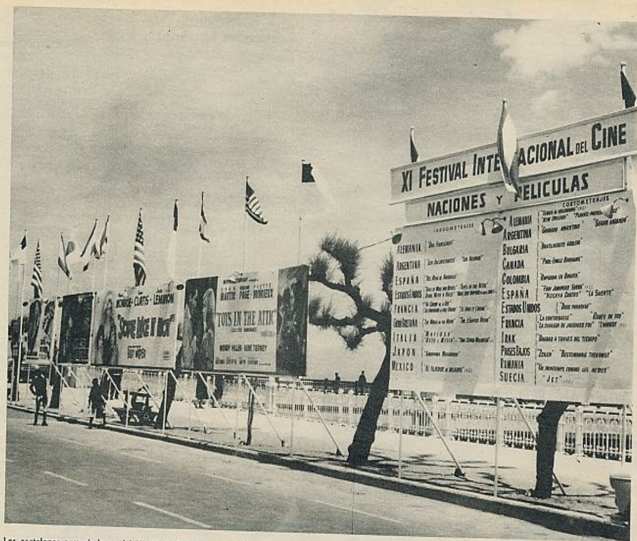
Los cartelones anunciadores del XI Festival de San Sebastián, en el Paseo Marítimo, ante el cine Victoria Eugenia, donde se celebran las proyecciones.