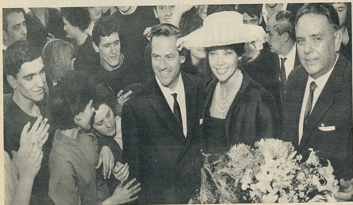
Al llegar a San Sebastián, Leslie Caron fue recibida por Mario Cabré, presentador del Festival. La Caron interpreta el film «The L-Shaped room» presentado por Inglaterra.