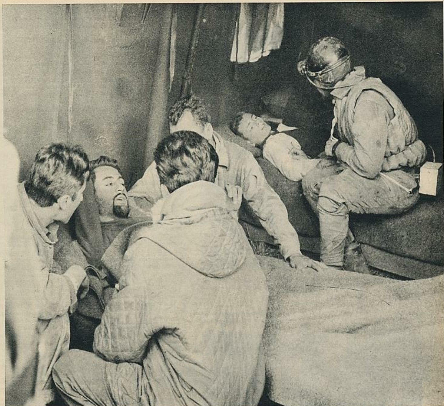
Para atender a los protagonistas de esta dramática excursión espeleológica se improvisó, a la entrada de la sima, una enfermería para los primeros socorros.