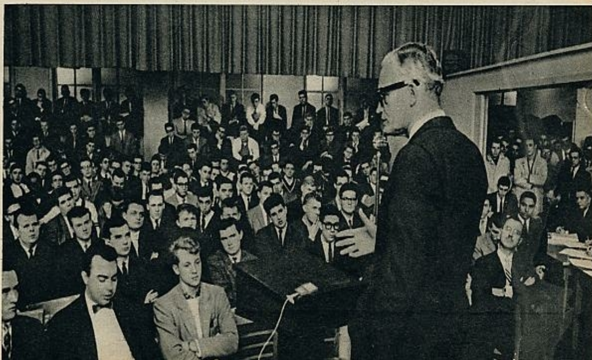
El fascismo de fondo existe en muchos sectores de opinión de los Estados Unidos, desde las ligas y clubs de fanáticos hasta algunos generales rezongones. Goldwater no está en ese punto; pero si conquistase la Casa Blanca podría ser el Presidente bajo cuya égida se desarrollase el fascismo norteamericano.

La posición actual de Johnson frente a Goldwater consiste en seguir amenazando en Cuba sin precipitar un desastre real, ni comprometerse en una acción suicida que le obligue a una retirada posterior, y continuar manteniéndose en el Vietnam, evitando que se forme en Saigón un Gobierno neutralista, hasta las próximas elecciones. Los dos temas son arriesgados.