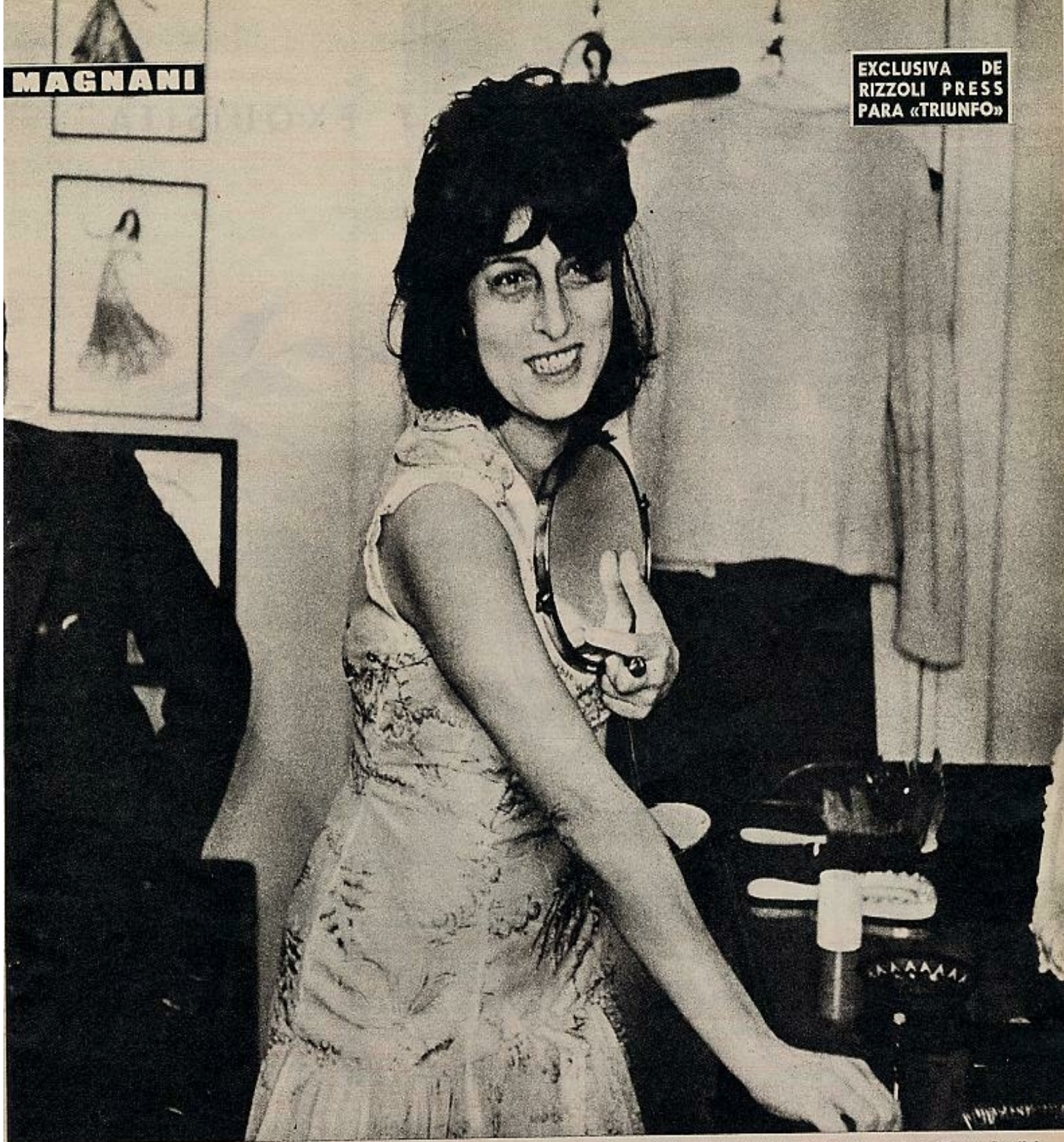
rodaje de «Mamá Roma» empezará dentro de pocos días; Al lado de Anna Magnani trabajará Franco Citti, el protagonista de «Accattone», primer film de Pasolini

proposiciones. Garantías y cifras para establecer a su gusto visado de aprobación del nombre de los otros actores..., todo con la reserva que es necesaria cuando hay de por medio una actriz consagrada por un Oscar y tildada con una terrible reputación. Ella abría la puerta de su casa, escuchaba hasta el fin con paciente cortesía y luego respondía con una negativa.