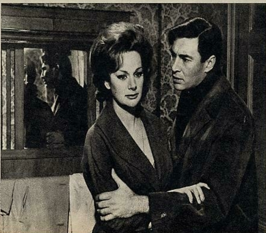
EL SOL EN EL ESPEJO