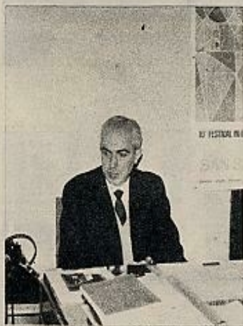
Don Francisco Ferrer Monreal, director del X Festival de Cine de San Sebastián

AMBIENTE: San Sebastián es una ciudad marinera, portuaria, fabril, pero también, y sobre todo, es una capital supercivilizada, supereuropea, cosmopolita. Al igual que en otras ciudades del Norte; pero quizá en San Sebastián se dé esto con mayor fuerza. El aire donostiarra viene decididamente desde Francia. Una cierta pulcritud, una esmerada limpieza, caracterizan a esta ciudad, que, sin embargo, no tiene el antipático aspecto de urbe encorsestada y enfundada en su guardapolvo; al contrario, San Sebastián es una ciudad abierta y jovial, desde sus calles recoletas hasta las grandes avenidas, desde el puerto a los maravillosos paisajes de los alrededores.