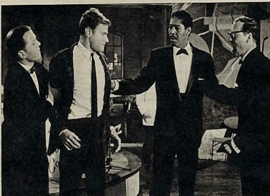
ALL NIGHT LONG