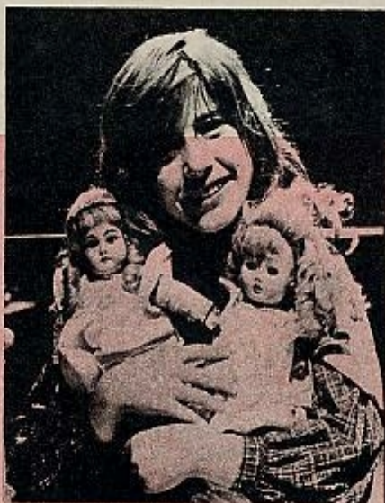
THE MIRACLE WORKER