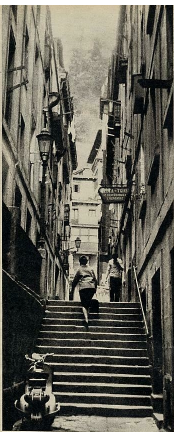
CALLE DE SAN SEBASTIAN