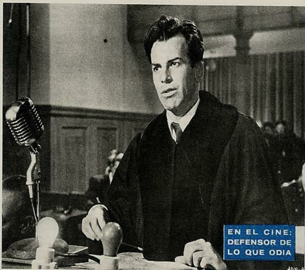
Su trabajo en «Vencedores y vencidos» le valió el Oscar unos años antes de la fecha en que esperaba obtenerlo.