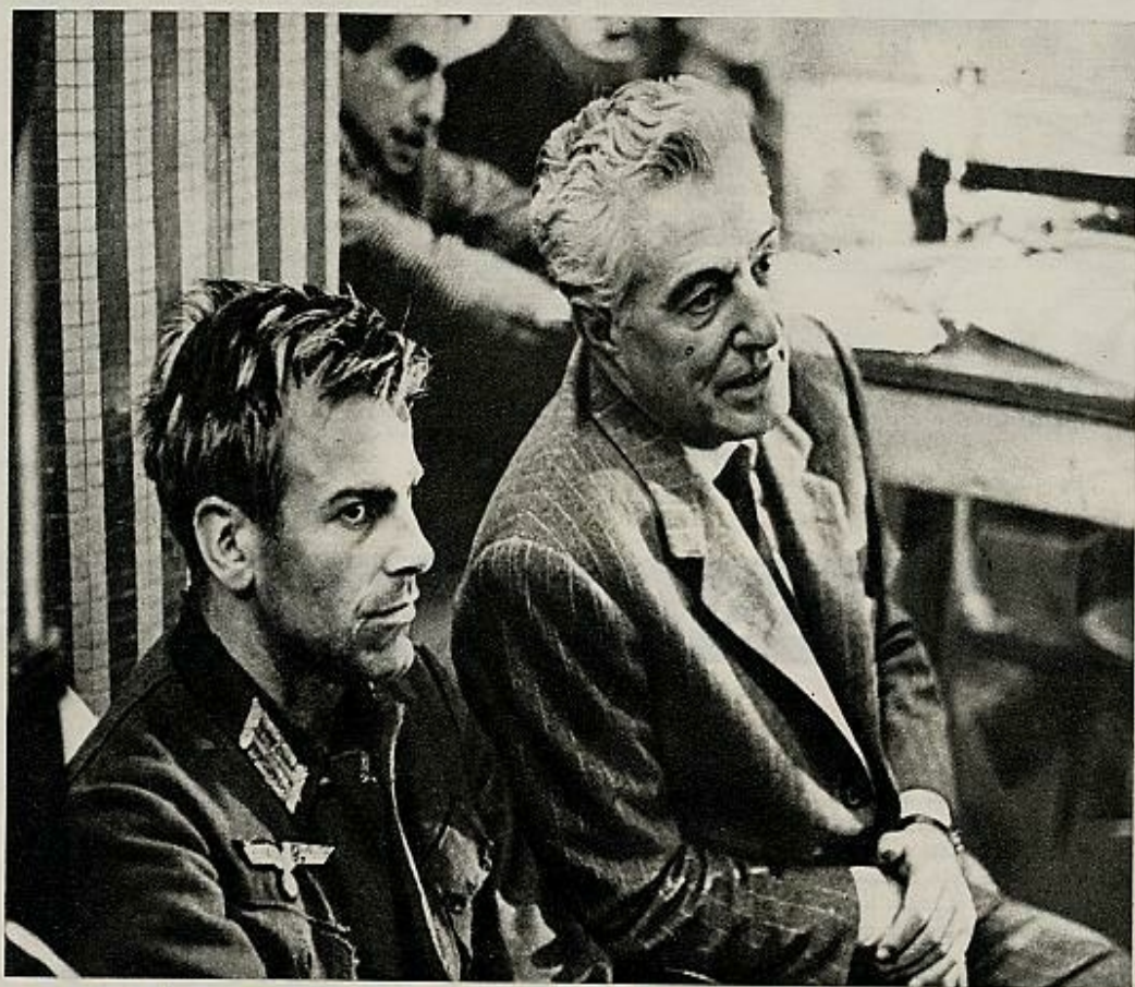
Schell, con De Sica, en la nueva película del director italiano. Maximilian Schell interpreta allí el papel de un nazi fanático.