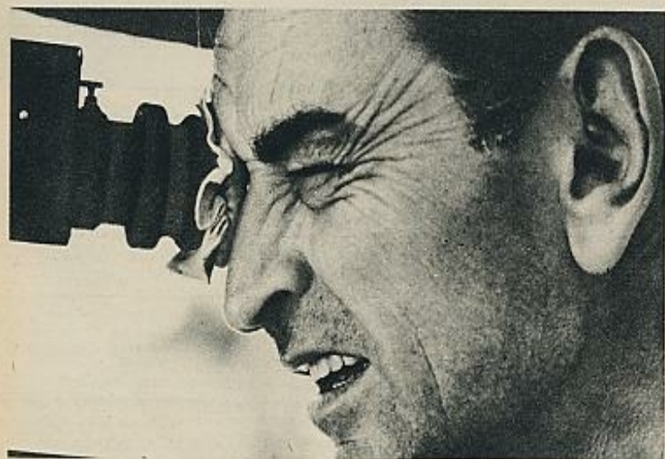
Es la segunda vez que el realizador británico David Lean obtiene el Oscar de la Academia de Hollywood. La vez anterior lo obtuvo por «El puente sobre el río Kwai». Con estos seis premios que le han sido otorgados a «Lawrence de Arabia», uno de los cuales es a la mejor dirección, David Lean recibe, definitivamente, el espaldarazo.