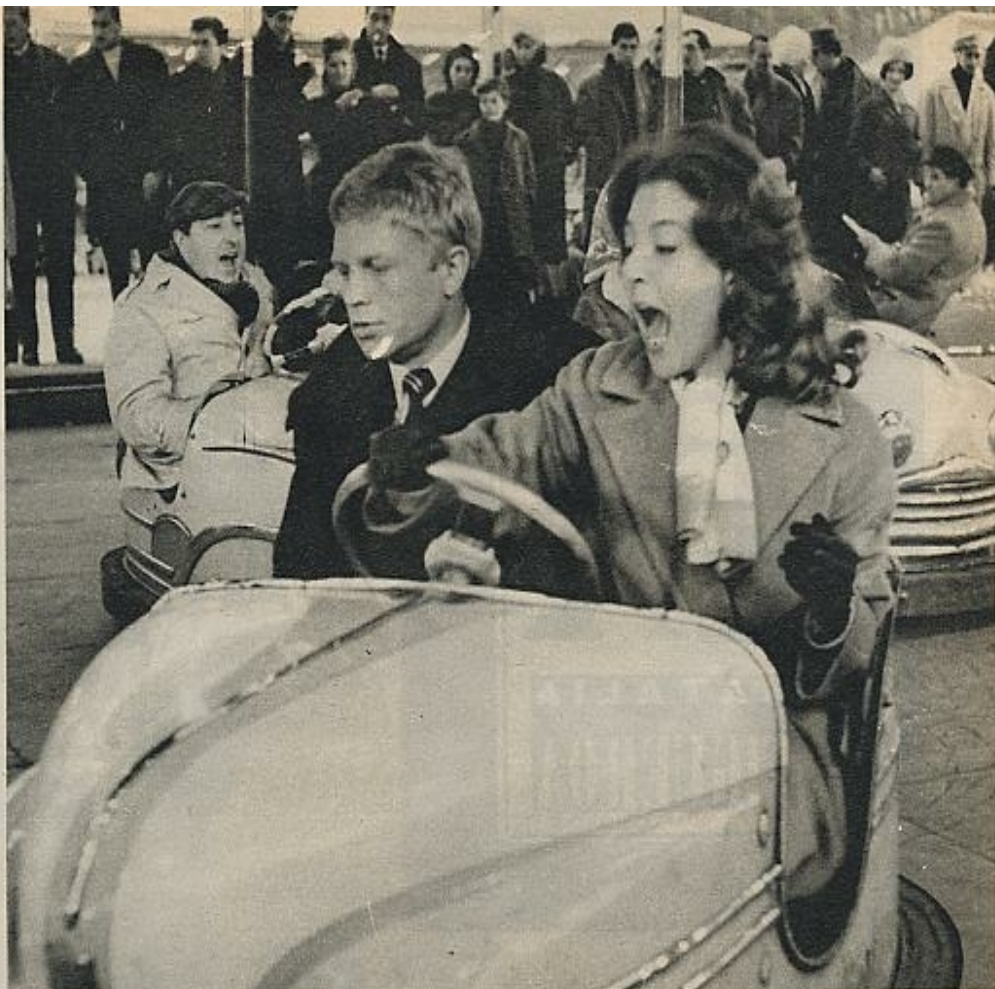
Ha sido una sorpresa que el Oscar al mejor film extranjero recayese sobre «Les dimanches de Ville-d'Avray», de Serge Bourguignon, de quien el público español conoce su cortometraje «La sonrisa». Se esperaba, con cierta seguridad por parte del público, que ese Oscar fuese concedido a «Le quattro giornate di Napoli», de Nanni Loy.