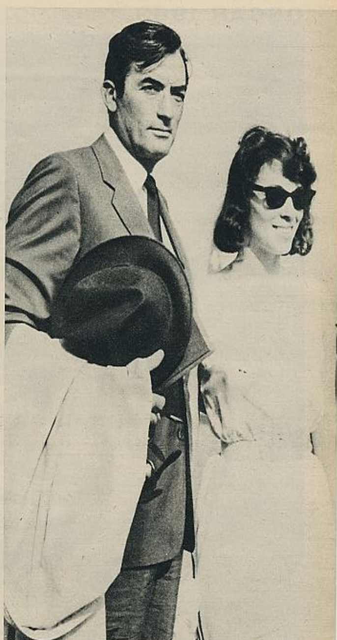
Parecía que el Oscar de Interpretación recayese en Peter O'Toole, por «Lawrence de Arabia». Sin embargo, fue para Gregory Peck por «To kill a mockingbird».