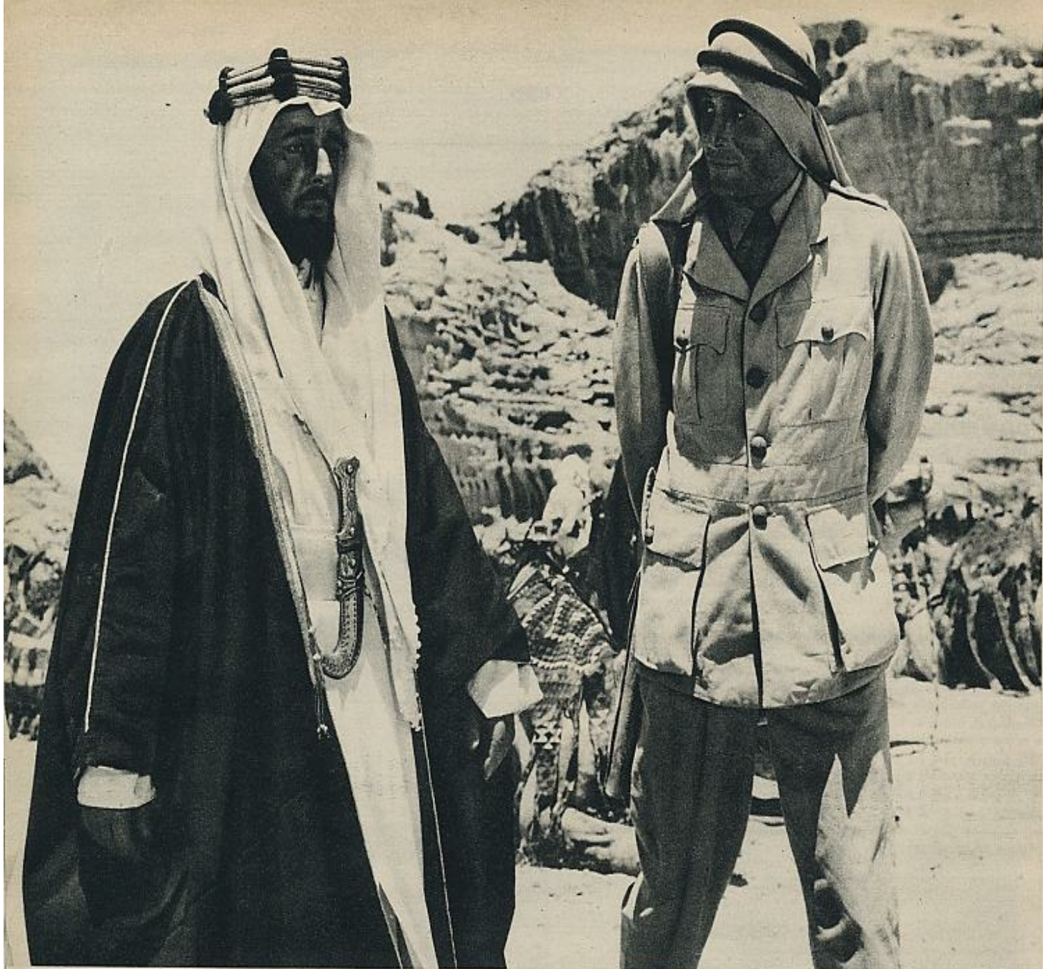
«Lawrence de Arabia» es la película que más Oscar ha acaparado este año: exactamente seis: a la mejor película, al mejor director, a la mejor producción en color, a la mejor dirección artística de film en color, a la mejor música y al mejor sonido. En la foto, Peter O'Toole y sir Alec Guinness, protagonistas del film dirigido por David Lean.