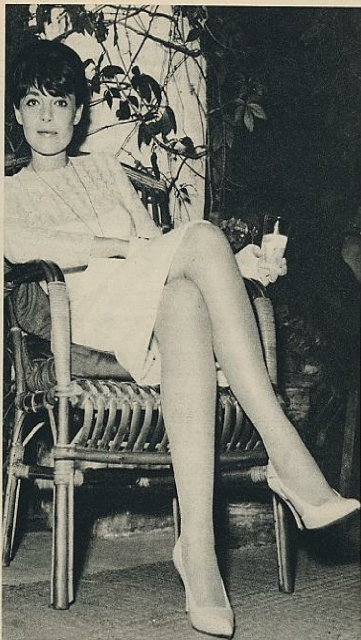
Anne Bancroft, la ganadora del Oscar de Interpretación, es una actriz que goza de sólido prestigio en el Broadway neoyorquino por su papel en la película «The Miracle Workers».