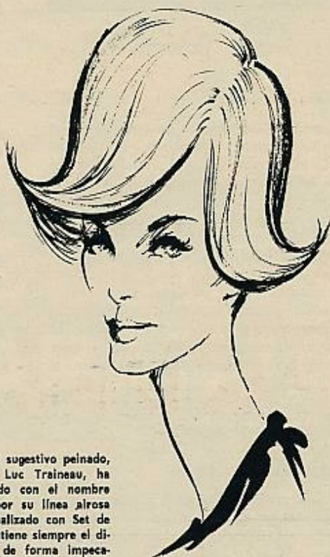
Este nuevo y sugestivo peinado, creación de Luc Traineau, ha sido bautizado con el nombre de «Puck» por su línea alrosa y juvenil. Realizado con Set de Pantene, mantiene siempre el diseño exacto de forma impecable, gracias al «spray» utilizado.