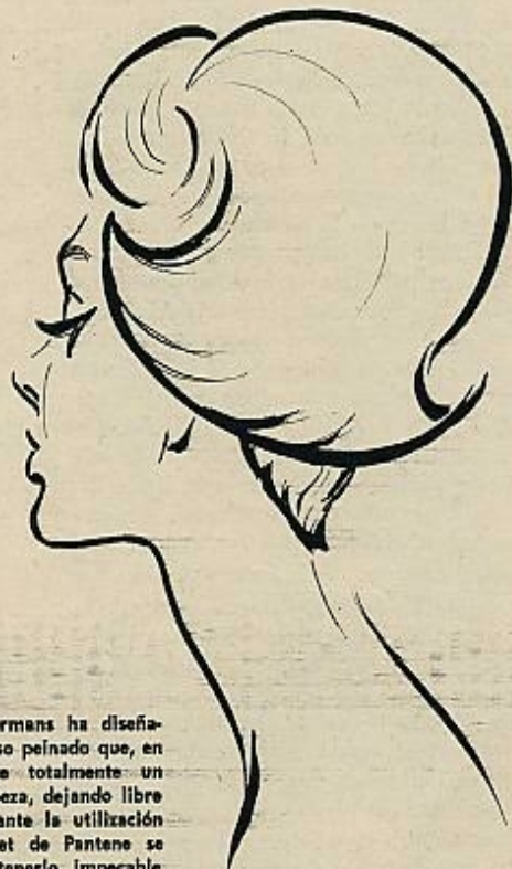
Aurelien Lintermans ha diseñado este gracioso peinado que, en síntesis, cubre totalmente un lado de la cabeza, dejando libre el otro. Mediante la utilización del «pray» Set de Pantene se consigue mantenerlo impecable aunque las condiciones atmosféricas no sean favorables.