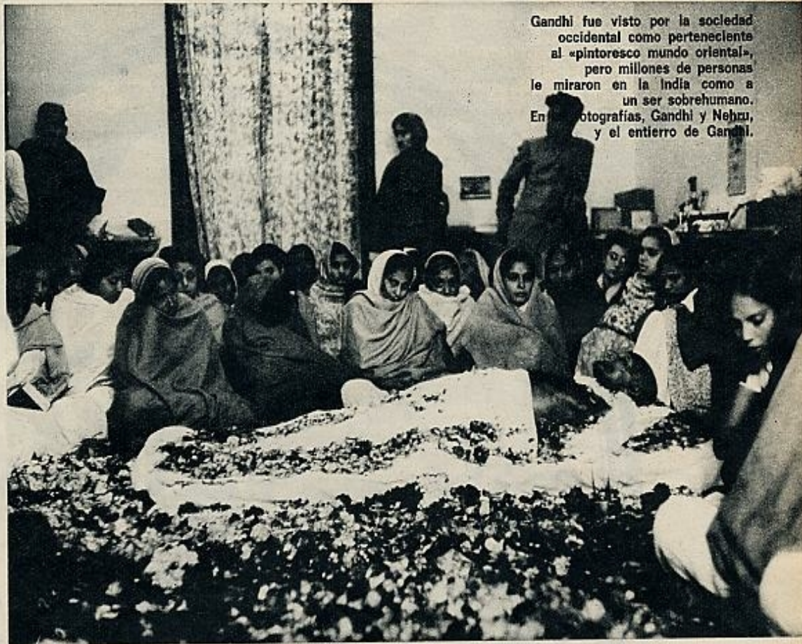
Gandhi fue visto por la sociedad occidental como perteneciente al «pintoresco mundo oriental», pero millones de personas le miraron en la India como a un ser sobrehumano. En fotografías, Gandhi y Nehru, y el entierro de Gandhi.