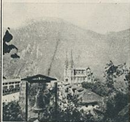
IMPRESA POR HERACIO FOURNIER