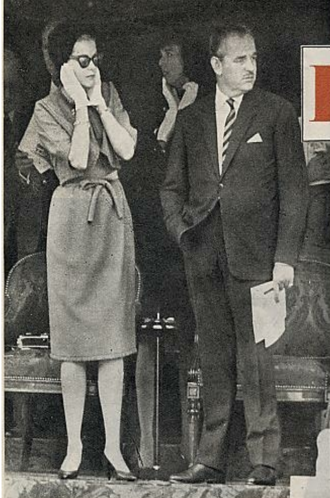
La princesa no hará cine