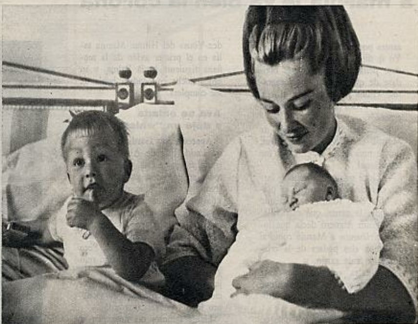
Pudo ser reina