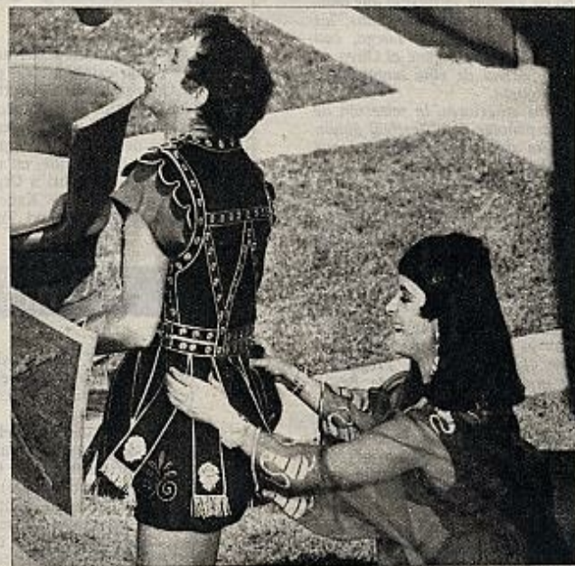
... con su papá, que ahora se llama Richard Burton, y que es muy guapo y muy fuerte y gusta mucho a las señoritas que van a contemplarle al cine...

caja de sombreros en «Cantando bajo la lluvia» y las crónicas de los periódicos nombrándole la pareja más feliz de Hollywood, el matrimonio mejor avenida del cine. Y ahora... Ralph estuvo a punto de atropellar a un ciclista al torcer una esquina. Afortunadamente tenía los reflejos a punto. Estaba acostumbrado a pensar en varias cosas a la vez. Luego llegó a su casa. Apretó el botón del ascensor.