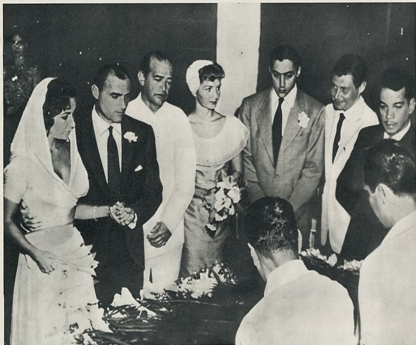
Matrimonio de Liz Taylor con el "coloso" Mike Todd. La noticia, fechada en Acapulco, aseguraba que la vida sentimental de la estrella entraba en una eterna fase de serenidad. Los padrinos eran Debbie Reynolds y su esposo Eddie Fischer. Tiempo después moriría Todd, y Fischer sería el marido número 4 de Liz