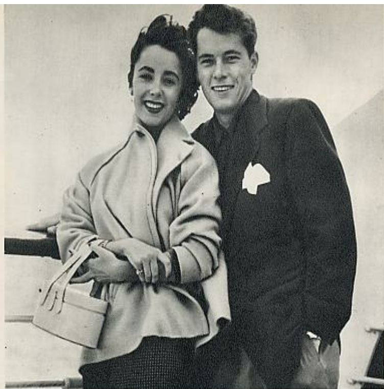
El primer matrimonio de Liz Taylor. A sus 18 años, la niña malcriada de la Metro, le decía que sí a Nicky Hilton, el de los hoteles: era un "play boy"...