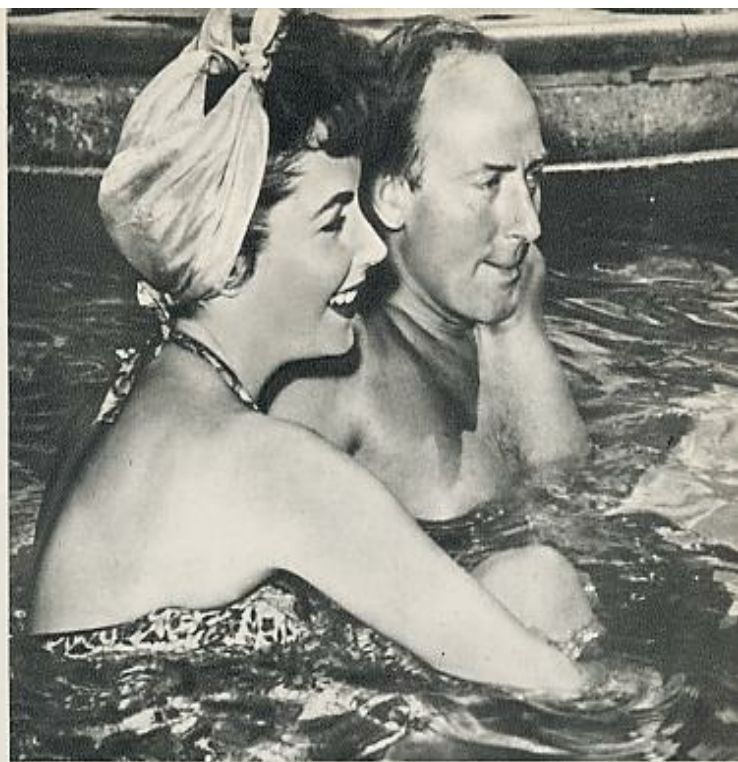
La de Michael Wilding parecía más serio. Los psicoanalistas habían dicho que Liz necesitaba un padre, un hombre mayor que la guiase, que la protegiese...