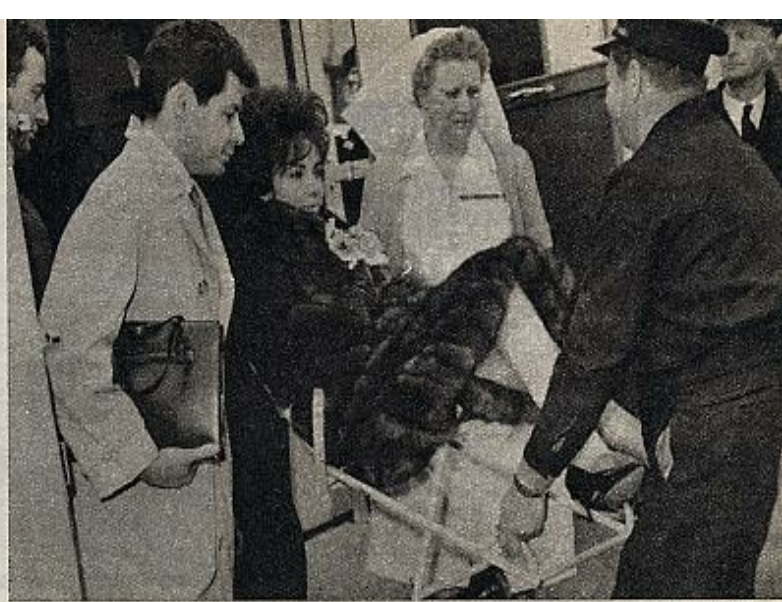
La última vez que estuvo enferma, el bueno de Eddie se pasó cuatro días y cuatro noches a su lado. La pobre Liz necesitaba que la quisieran mucho

Al año siguiente —debía ser 1959— anunció su boda con Eddie Fisher. Cuando Ralph Cowan leyó la noticia soltó un juramento. Pidió la nota del restaurante donde estaba y se marchó. Parecía imposible. Debbie Reynolds —la esposa de Fisher— era su mejor amiga. La había ayudado en los momentos más difíciles. Había sido testigo en su matrimonio con Mike, allí en Acapulco. Se lo había prestado todo... menos el marido, naturalmente. ¿Y él? Ralph Cowan, mientras conducía su coche, recordaba la cara de Eddie. Parecía un buen chico. Se había hecho famoso cantando canciones al estilo de Sinatra. No era lo mismo, claro; pero de algo hay que vivir. Recordaba también a Debbie saliendo de una gran