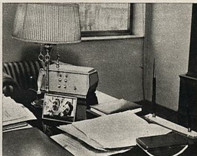
FOTO DE LA FAMILIA

No se trata de un coleccionista. El sólo quiere conservar los mensajes que le envían las personas queridas o los recuerdos de sus vacaciones, sea por una incontestada necesidad de afecto, sea por una forma de exhibicionismo. Por lo demás, le gustaría tener a su alrededor personas adictas