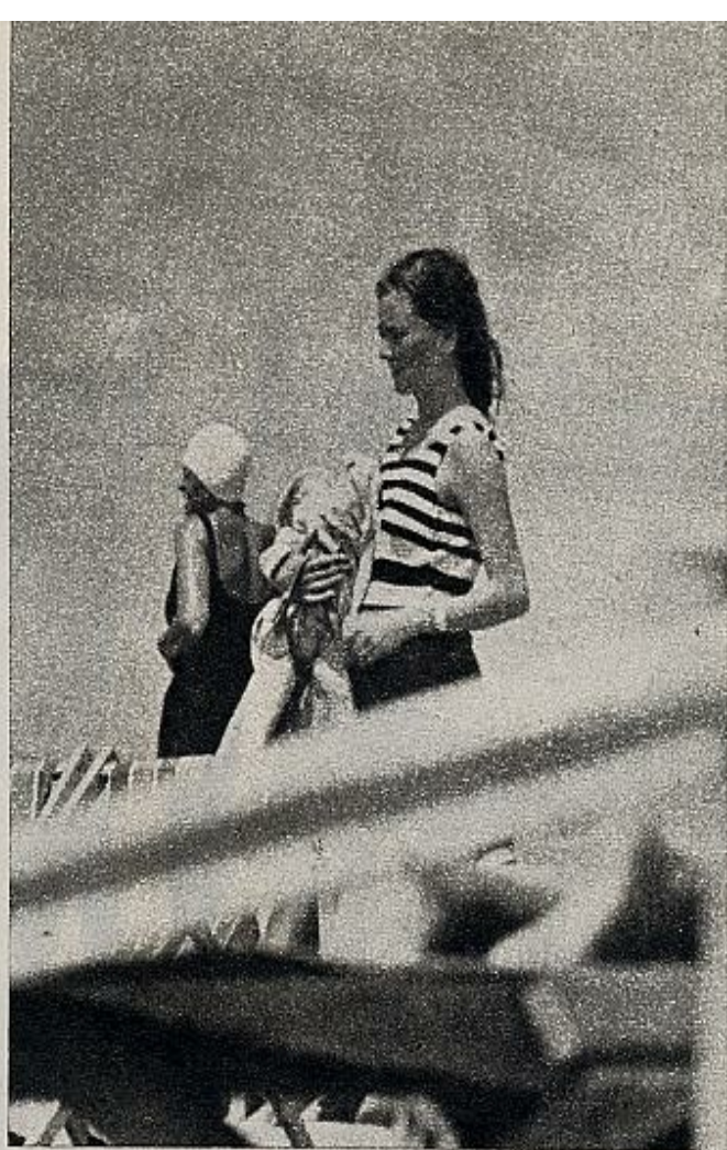
la última moda: «maillot» 1935

El más enfadado ha sido siempre el príncipe Alberto, que se ha encarado continuamente con los reporteros gráficos, amenazándoles. Paola, por el contrario, se limitó a poner un gesto de fastidio en su cara tostada cuando intentaron captar la imagen de su hijo al que llevaba en brazos. Después se marchó a tumbarse despectivamente en la arena de su playita particular, a continuar poniéndose morena. Llevaba un maillot de última moda: modelo 1935, rayado el cuerpo y de color azul marino el pantalón.