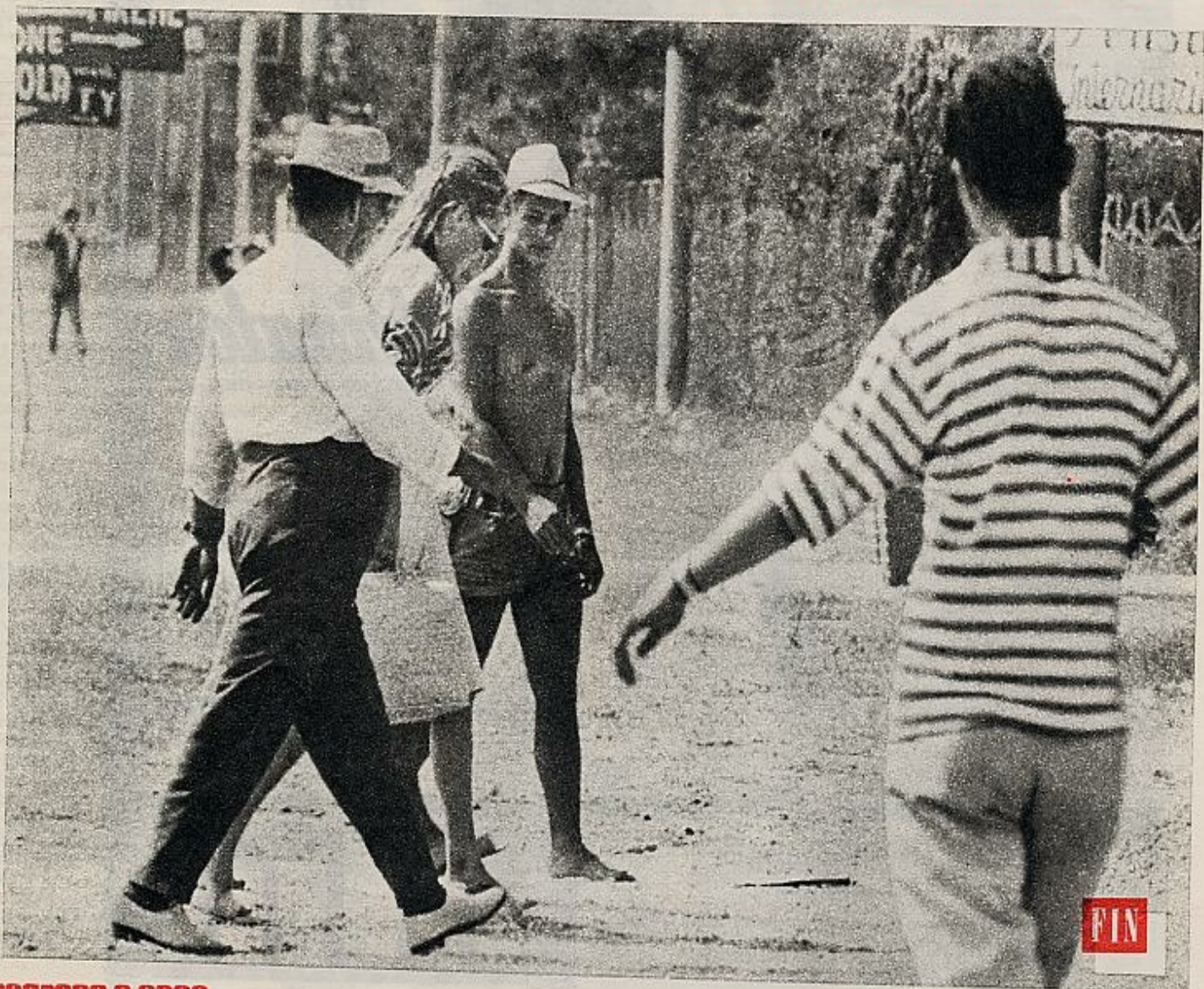
regreso a casa