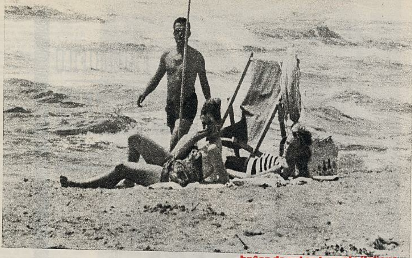
baños de sol en la costa italiana