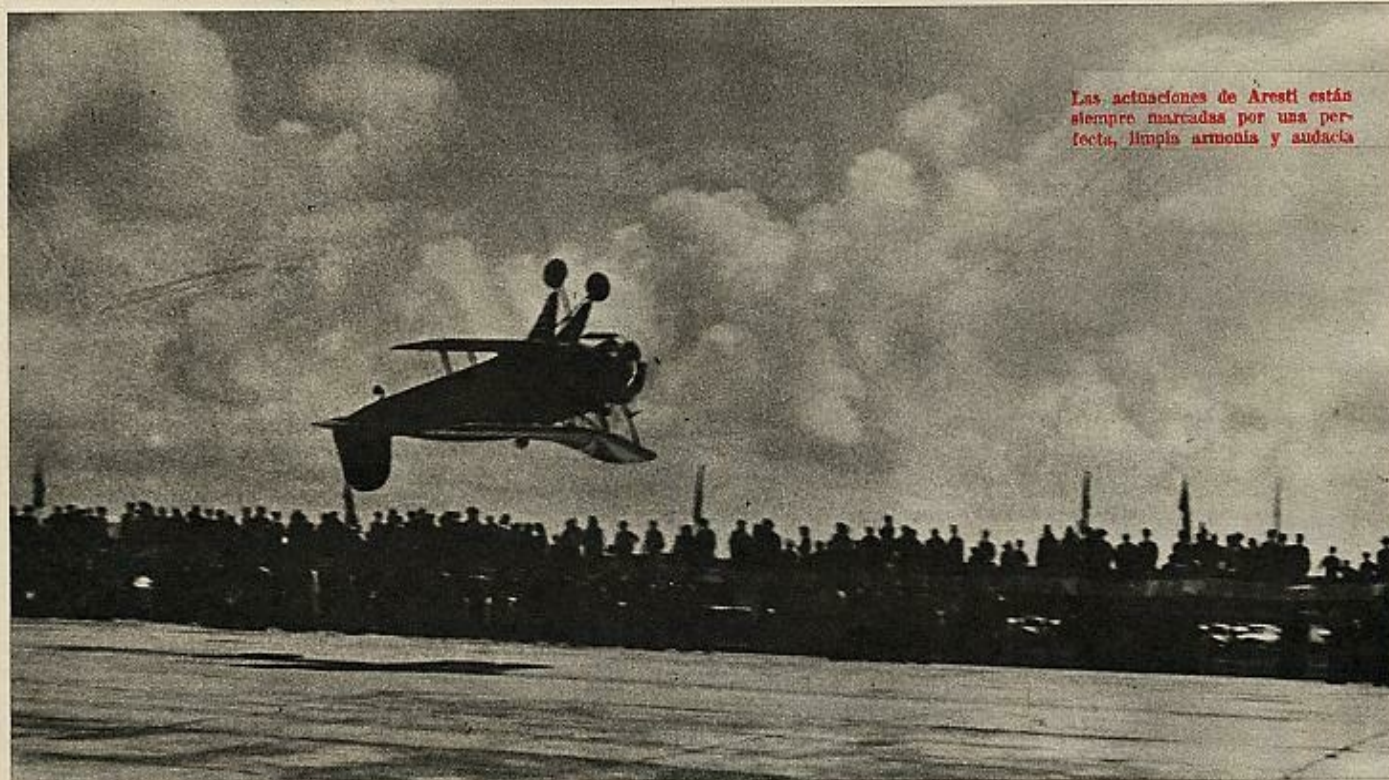
Las actuaciones de Aresti están siempre marcadas por una perfecta, limpia armonía y audacia