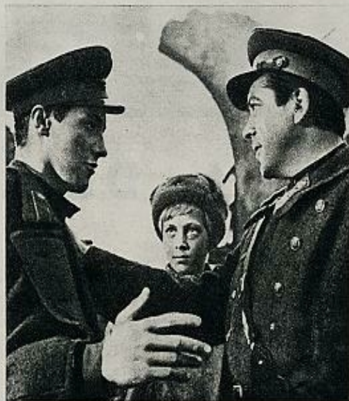
«La infancia de Iván»