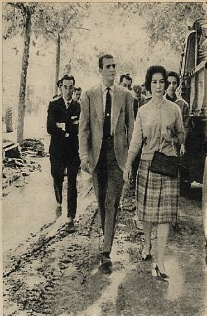
Sofía de Grecia y Juan Carlos de Borbón interrumpieron su estancia en Estoril con los condes de Barcelona para visitar los puntos más castigados por el temporal. Esta imagen fue tomada durante su recorrido por Tarrasa