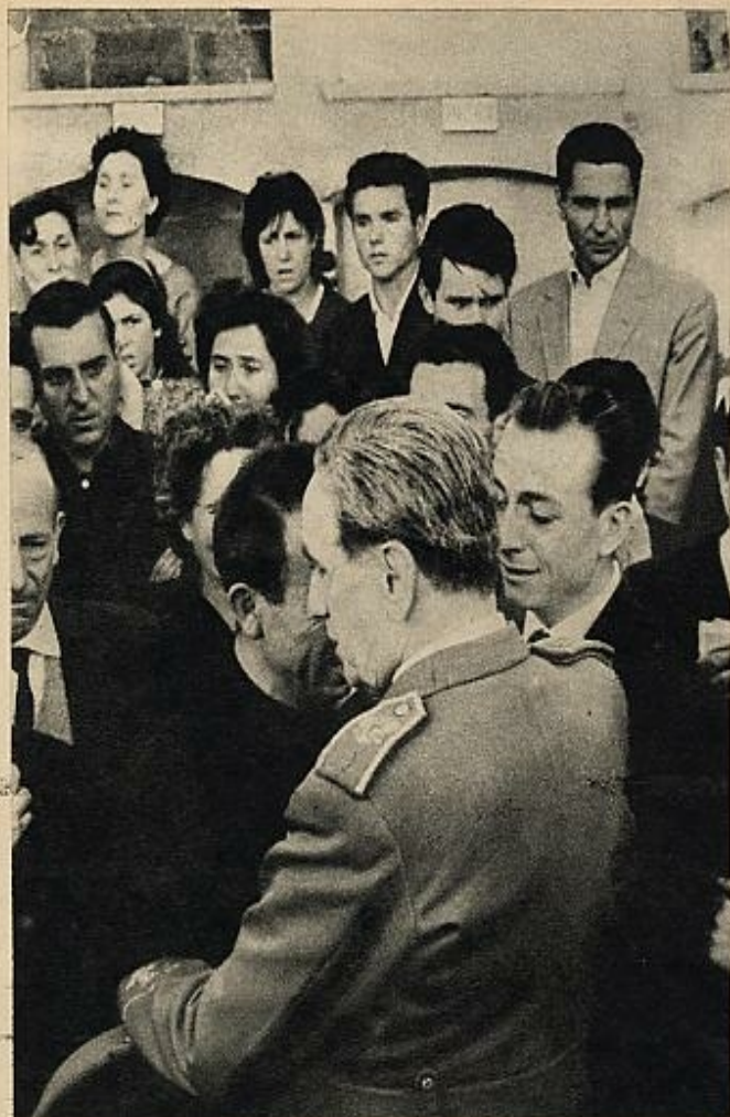
Vosotros os levantaréis... El vicepresidente del Gobierno, capitán general Muñoz Grandes, trata de consolar a los familiares de las víctimas. El apoyo moral es difícil. Y, sin embargo, estas gentes, algún día, lo recordarán