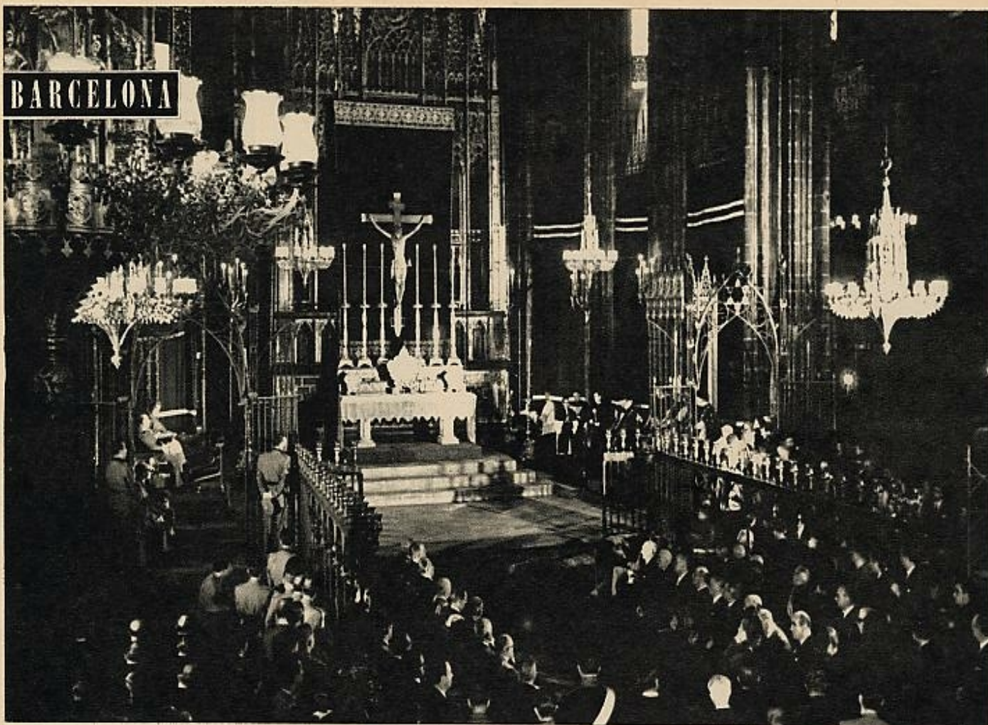
El Jefe del Estado y las altas jerarquías de la nación presidieron en Barcelona un Tedéum solemne por las víctimas. Franco recorrería después con los ministros las zonas afectadas por las inundaciones

de los Pirineos era una lluvia poderosa y casi musical, agradecida por los campos. Se abatía sobre las lagunas y las marismas como un cepillo líquido que borra la peste y el ardor de una prolongada sequía. En la frontera, al entrar en España, las noticias eran todavía contradictorias; en la faz de los hombres fronterizos estaba el estúpido, la inquietud y un silencio dolorido. Algunos coches habían llegado ya, cruzando la zona arrasada. La carretera, del lado de allá, iba a ser la estela de la muerte y de la aflicción.