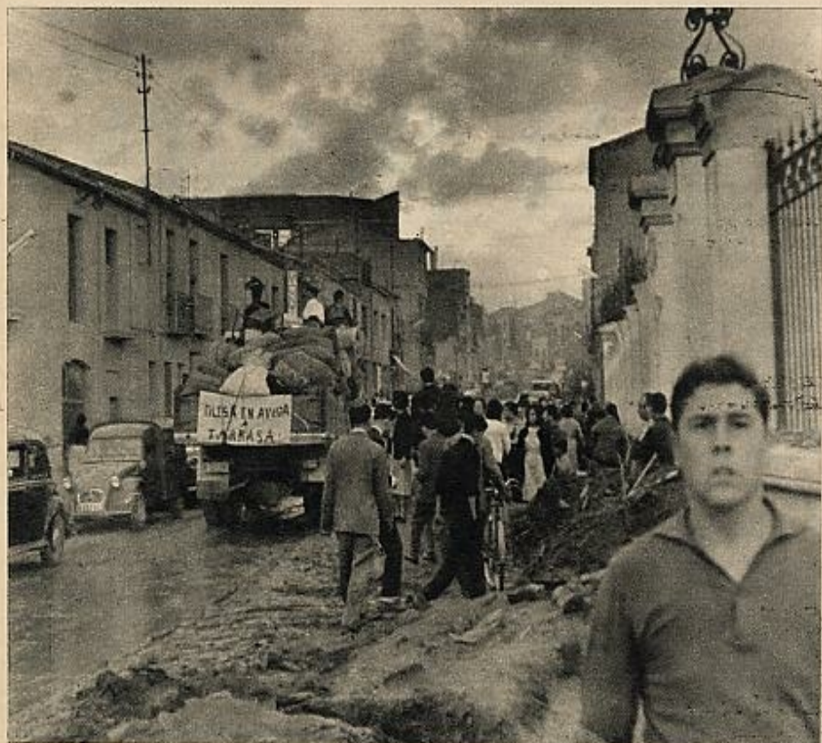
Desde el primer momento los damnificados contaron con un apoyo total por parte de España entera. Los pueblos de la provincia catalana fueron los primeros en movilizarse, enviando su ayuda material en toda clase de envíos: ropas, viveres, agua... En seguida, todas las regiones ayudan a Cataluña