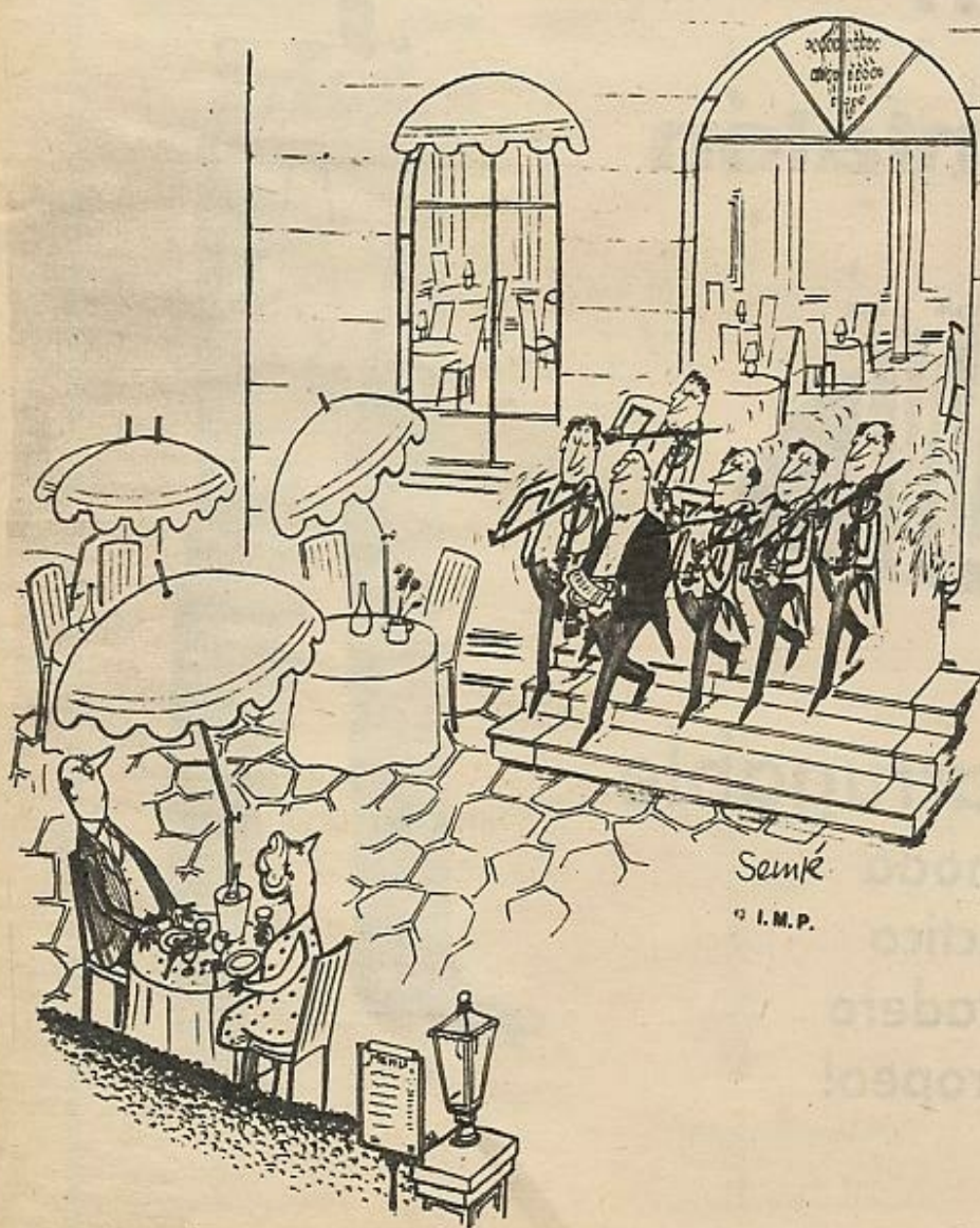
Senik © I.M.P.

VERTICALES. - 1: Una. Domestica. - 2: Pongo el pie sobre algo. Nombres de letra. - 3: Cierto pescado. Entregaré. - 4: Hacer poesías. Aposentar. - 5: Emesadas. - 6: Convulsión. - 7: Figuras geométricas. - 8: Dilatados. Alimentos líquidos. - 9: Al revés, capital europea. Palabra que se usa como contrasello en algunos concursos. - 10: Costoso. Al revés, mojón. - 11: Al revés, sin gracia. Nombre de mujer.