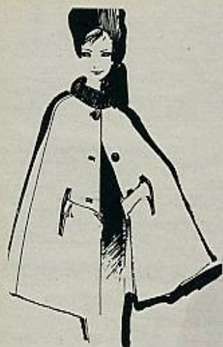
Capa abierta en piel de camello, con tres botones y cuello de lana.