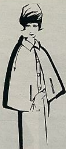
Capa en lana verde sobre un traje del mismo material.