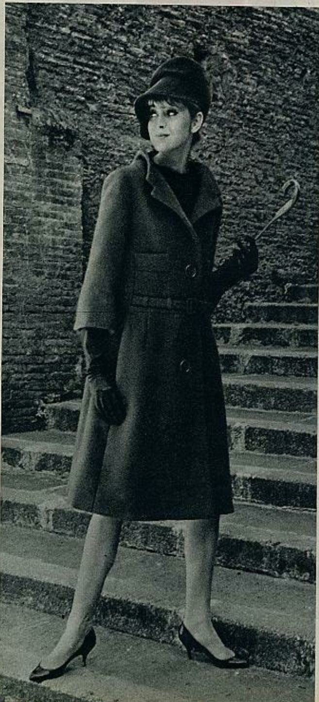
DE BARENTZEN. Abrigo en lana roja, con medio cinturón, y cuello desbocado.