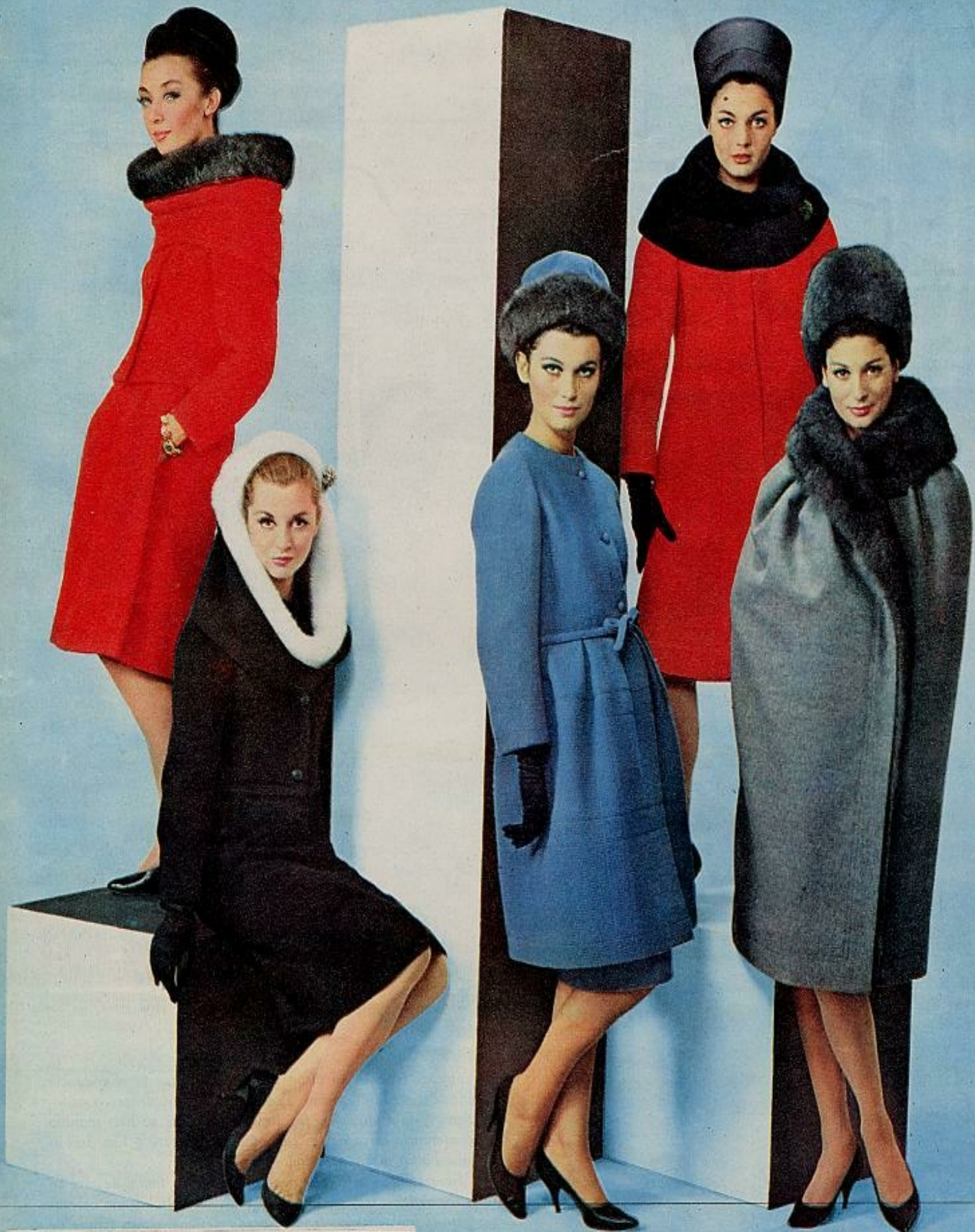
CINCO MODELOS DE NINA RICCI. De izquierda a derecha: Dos piezas rojo en mohair de lana, chaqueta corta y gran cuello-bufanda ribeteado en zarigüeya. Dos piezas negro de lana con cuello-capuchón ribeteado en armiño. Abrigo turquesa de lana sin cuello, con gorro guarnecido de zarigüeya. Abrigo rojo, en lana gruesa, con cuello de piel. Capa gris doblada en zarigüeya, con gorro de la misma piel.