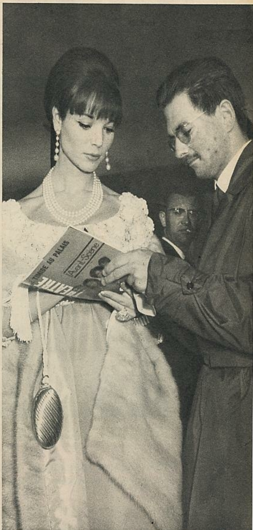
Elsa Martinelli, la estrella más viajera del cine italiano, siempre elegante y estilista, rinde el acostumbrado tributo a la fama firmando un autógrafo a uno de sus admiradores.