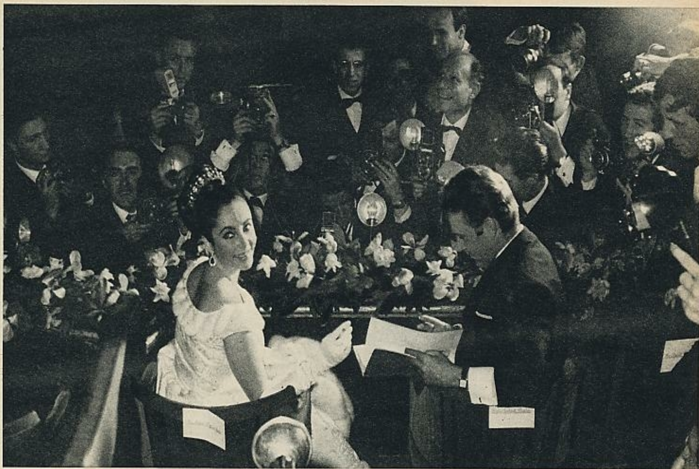
Una vez terminada la proyección, Liz Taylor y Richard Burton posaron pacientemente para los fotógrafos. En ningún momento Liz perdió su sonrisa...