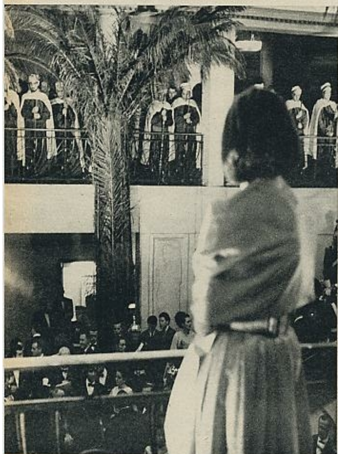
Figurantes vestidos de árabes y palmeras «evocaban» en el vestíbulo el ambiente donde se desarrolla la acción del film.