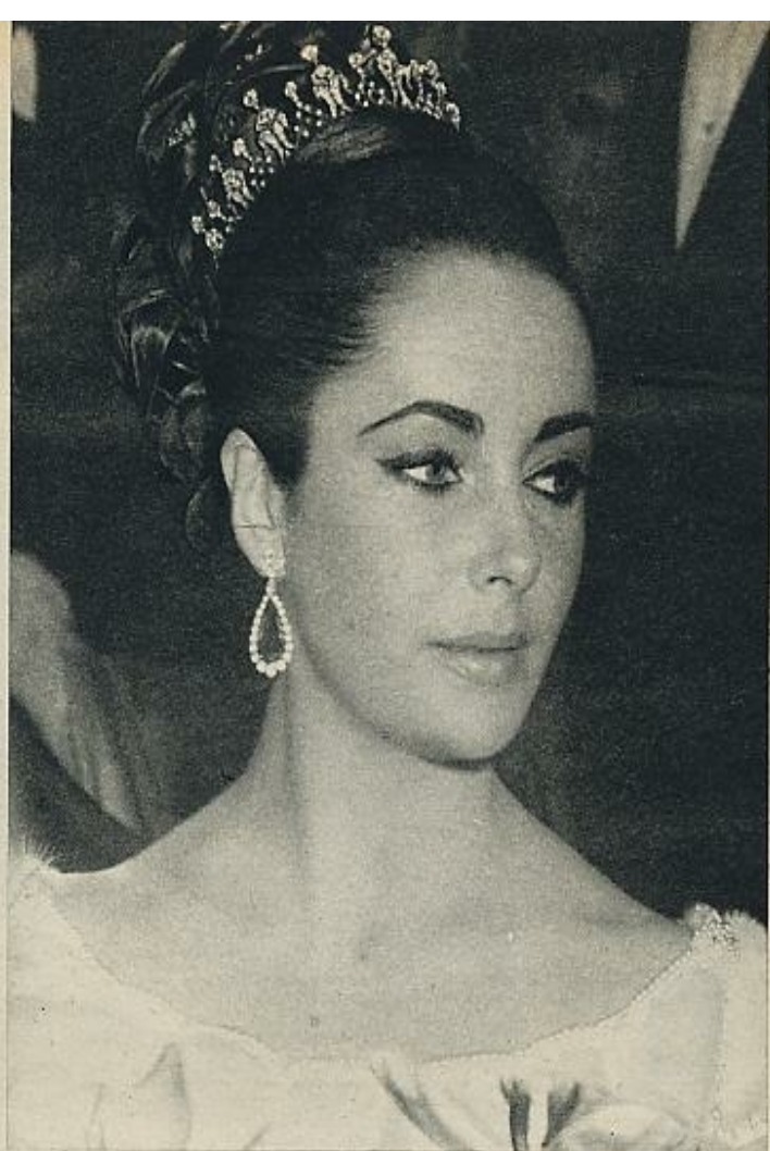
Una larga y cálida ovación saludó la entrada de Elizabeth Taylor en el Teatro de los Campos Eliseos, donde tenía lugar la «première» parisina de «Lawrence de Arabia».