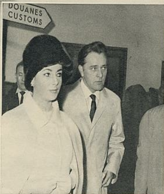
Liz Taylor y Richard Burton a su llegada al puerto de Calais. Debido a la huelga de ferrocarriles tuvieron que hacer viaje en coche a París.