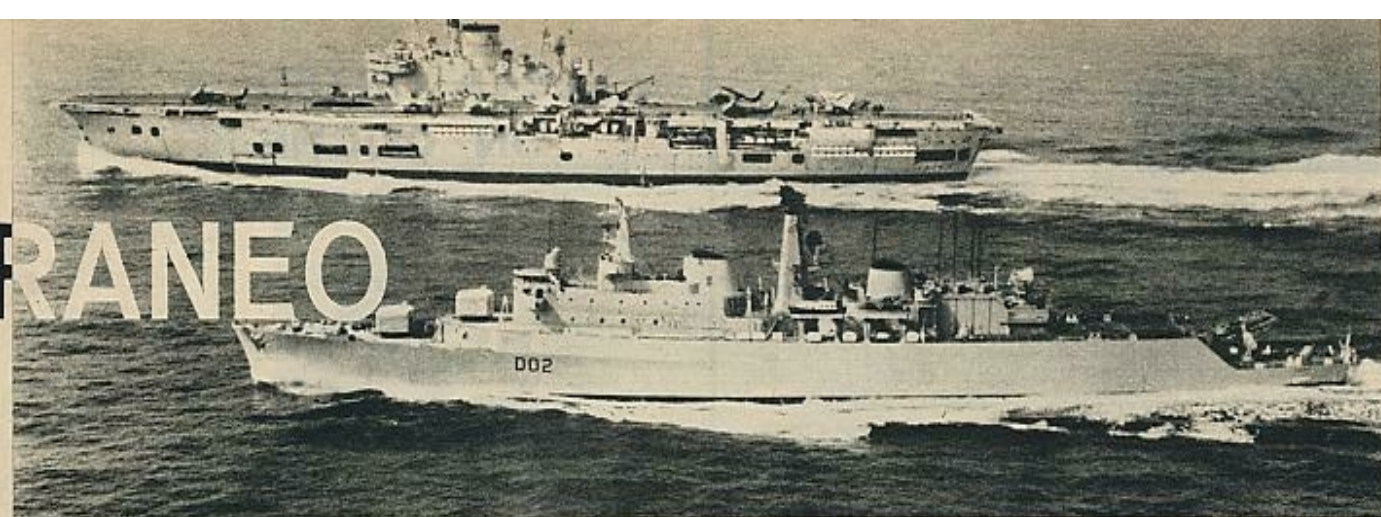
El portaaviones «H. M. S. Ark Royal» y el destructor «Devonshire», en las maniobras aeronavales realizadas en el «Mare Nostrum», en combinación con la R. A. F.

cia de Ottawa, la URSS lanza una nueva campaña, una nueva ofensiva verbal: la campaña por la desatomización del Mediterráneo. Una parte esencial de esta campaña es puramente psicológica; otra, política. La campaña psicológica tiende a impresionar a los países ribereños del mar, y alude a principios que estima sagrados para dichos países: «Si llegase lo peor —dice la nota enviada a varias naciones costeras y a los Estados Unidos y la Gran Bretaña, cuyas fuerzas navales y aéreas son las que van a convertirse en protagonistas nucleares del mar—, el Mediterráneo se transformaría en un mar muerto y los hogares prestigiosos de la civilización y de la cultura sufrirían una suerte parecida a la de Pompeya. Incluso todos aquellos que están libres de creencias religiosas pueden comprender los sentimientos que experimentan millones de cristianos y musulmanes al ver cómo los dirigentes de la OTAN instalan sus armas nucleares bajo los muros del Vaticano, de Jerusalén, de La Meca.»