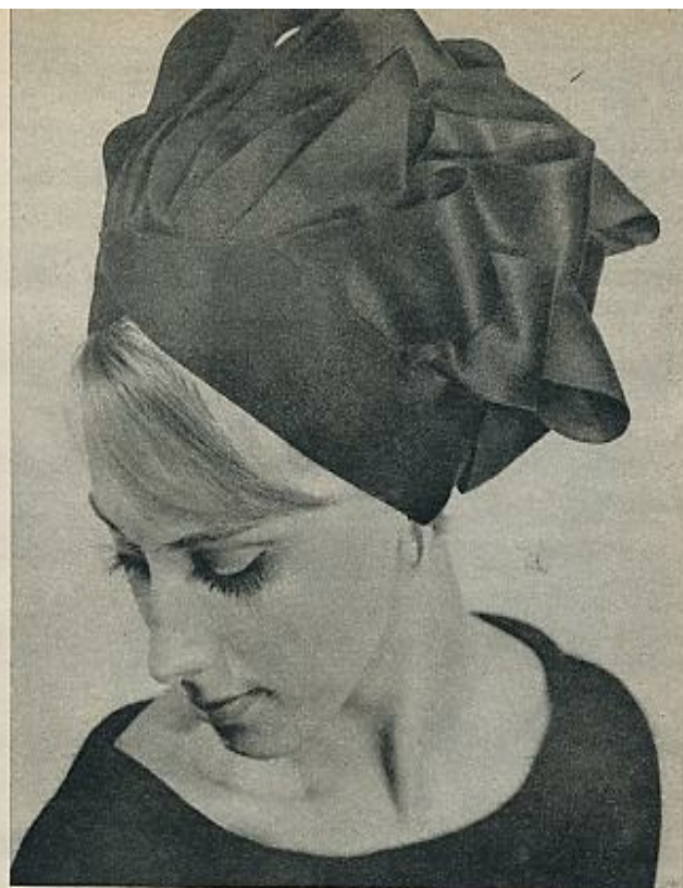
Una variación del modelo «Fanchon», de Heim, muy indicado para cocktail. Se compone de lazos de satín negro montados sobre un bandó haciendo juego.

Paulette ha presentado los sombreros de su nueva colección y sus creaciones confirman las tendencias observadas en las creaciones de los demás modistas. Paulette utiliza mucho los pañuelos, que en diferentes tejidos serán usados indistintamente para ir en