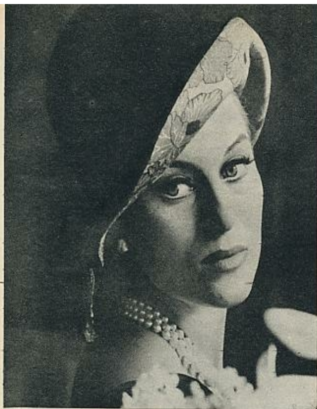
Inspirándose en George Sand, Barthe ha creado este modelo «cloche» en terciopelo marrón forrado de satín estampado en amarillo, ocre y naranja.

En los cócteles se llevarán los sombreros de estilo «Tom Pouce». Este es un casquete de tul negro con un velo que lleva lunares de terciopelo.