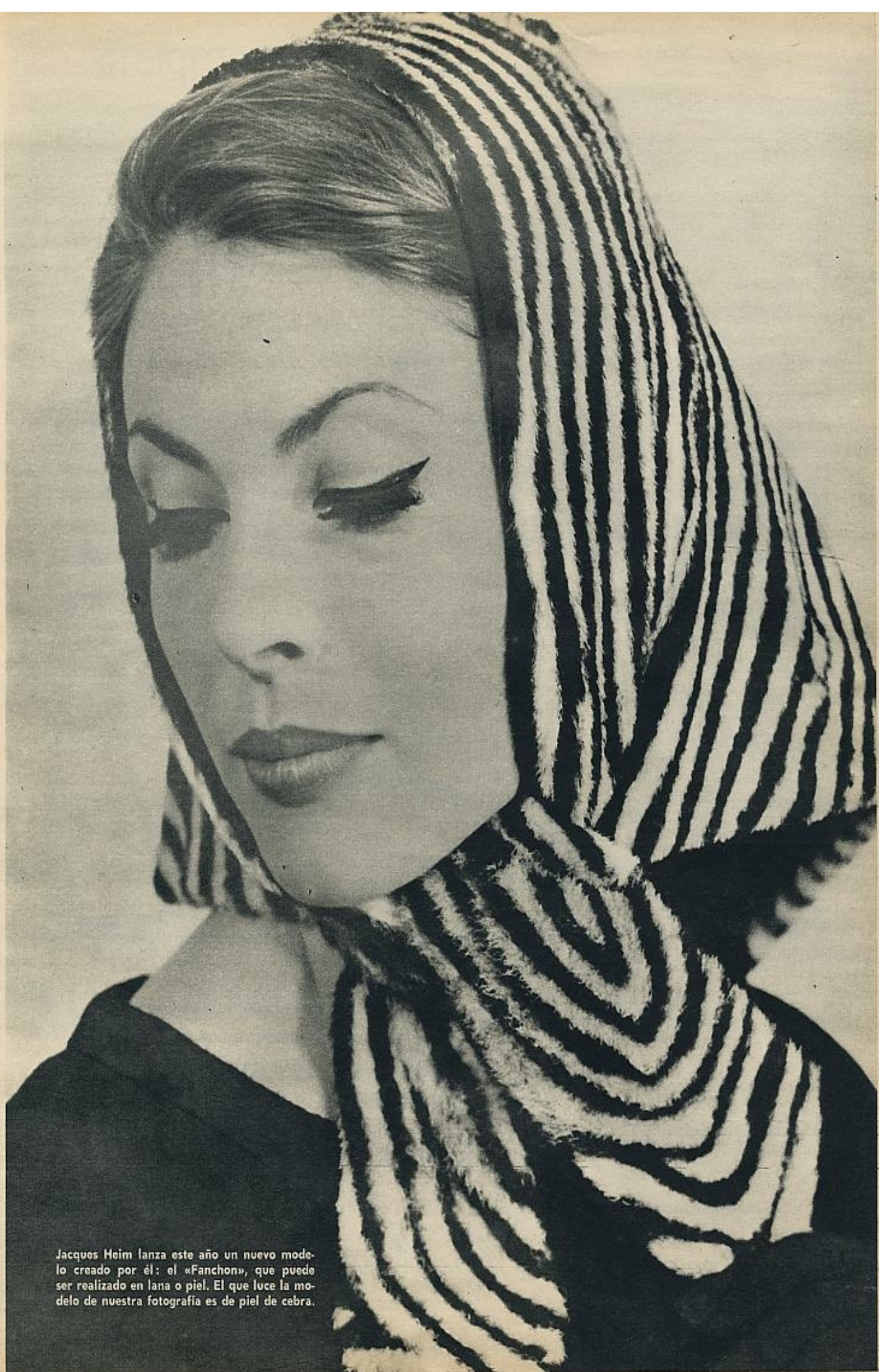
Jacques Heim lanza este año un nuevo modelo creado por él: el «Fanchon», que puede ser realizado en lana o piel. El que luce la modelo de nuestra fotografía es de piel de cebra.