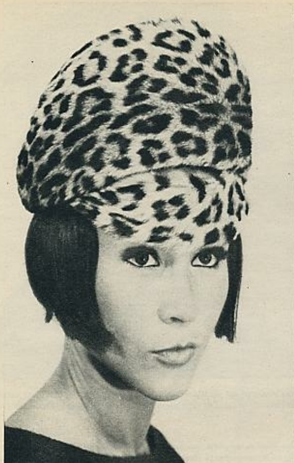
Esta boina con visera, colocada sobre las cejas, recibe el nombre de «Bengala»; puede ser realizada indistintamente en piel o en terciopelo.