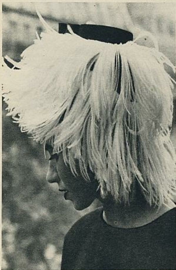
Una elegante y original peluca, creación de Paulette, muy adecuada para las salidas de noche. Está formada por plumas blancas de avestruz.