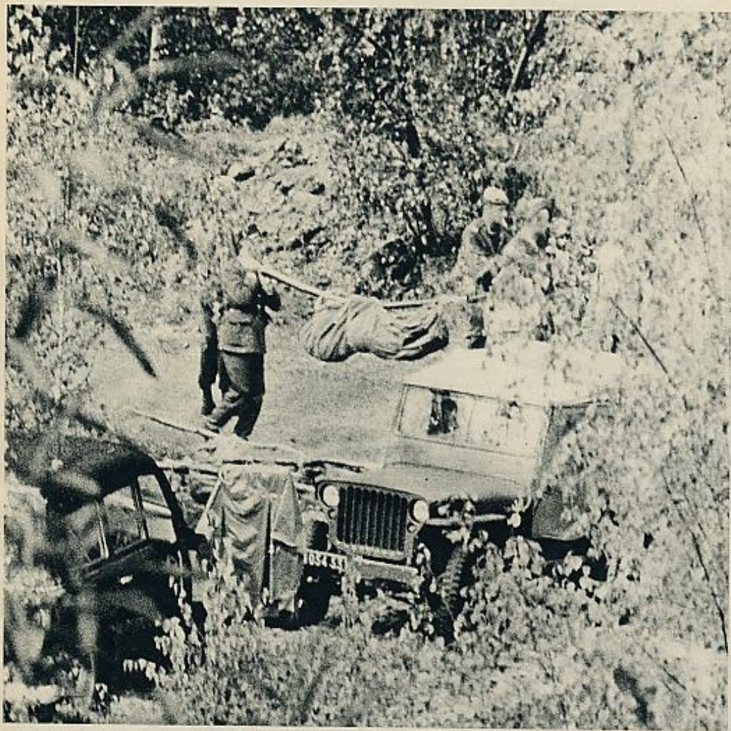
Arriba, a la derecha, los restos del «Viking» Londres-Perpignan, que se estrelló recientemente en los Pirineos. Sobre estas líneas, el traslado de una de las víctimas en un saco de lona. Abajo, una de las operaciones de rescate que han sido dificultadas por la lluvia incesante y la niebla. Paracaidistas y gendarmes trabajan para recuperar las cuarenta víctimas.