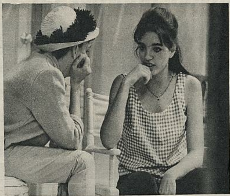
Para el nuevo programa de TV han recurrido a una serie de números estrechamente relacionados con lo más tradicional del mundo del «music-hall» americano, casi del «burlesque», dentro de la más pura línea musical anglosajona, que mejor caracteriza a Judy.