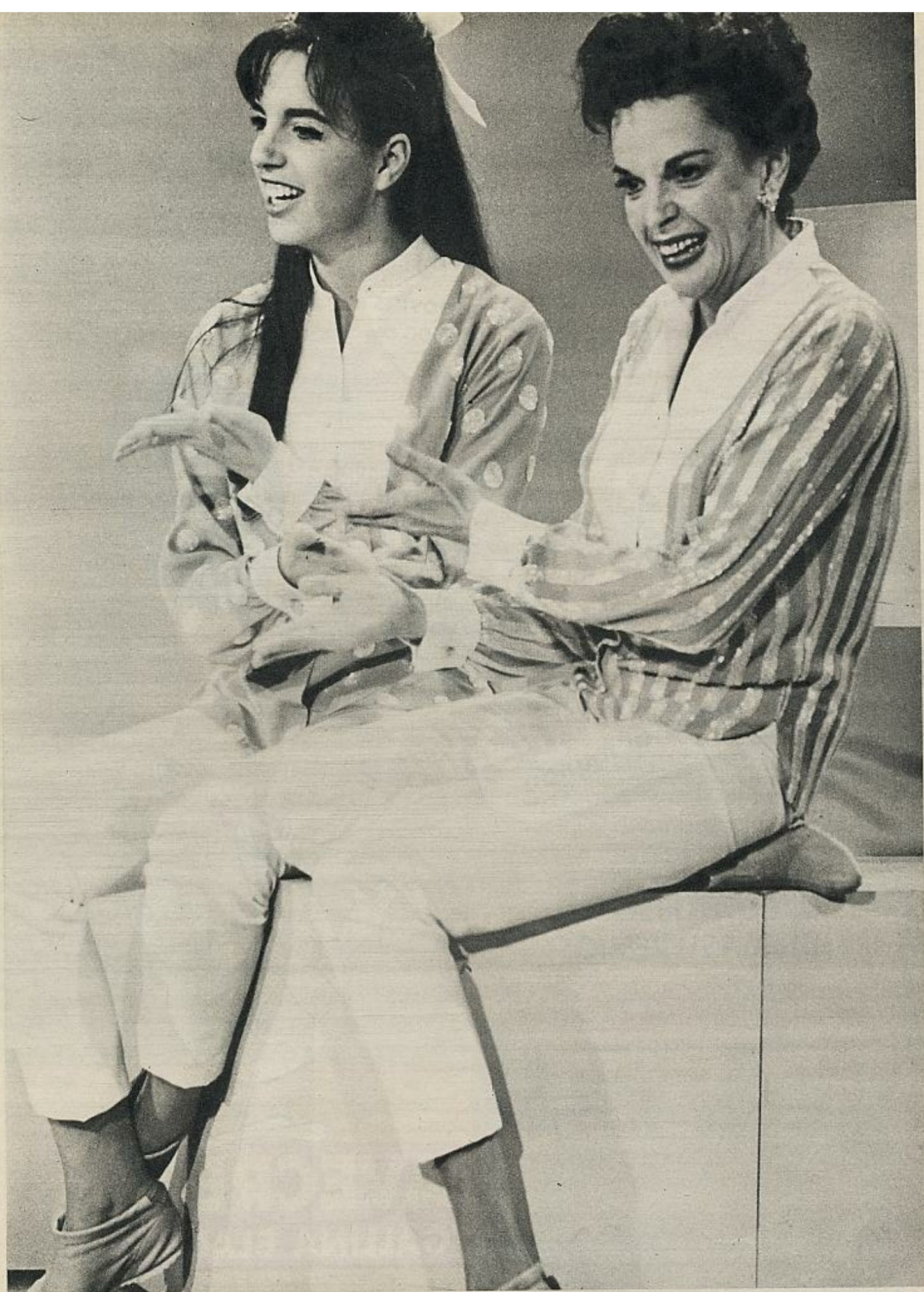
La gran veterana de Hollywood ensaya concienzudamente en unión de su hija, a la que se augura un brillante porvenir. En los «círculos artísticos» se asegura que ha heredado el talento de cantante de su madre y el de coreógrafo de su padre, Vincent Minnelli, creador de famosas comedias musicales, como «Un americano en París».