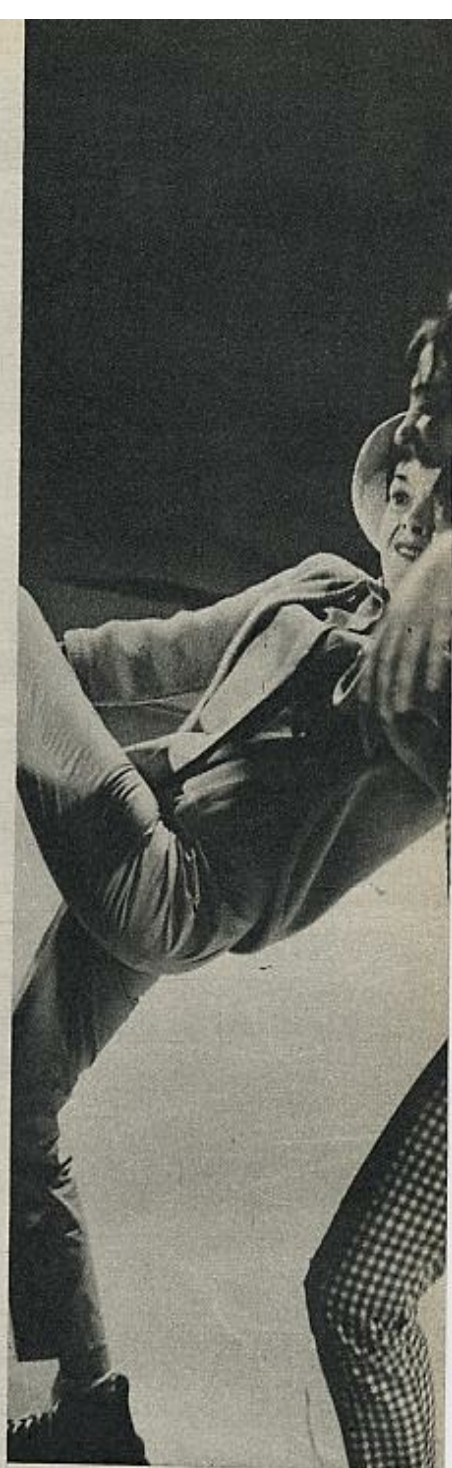
Bajo la atenta supervisión de Judy Garland, su hija aprende los secretos de la profesión, en unos ensayos agotadores. Ya queda poco tiempo y ésta puede ser la gran