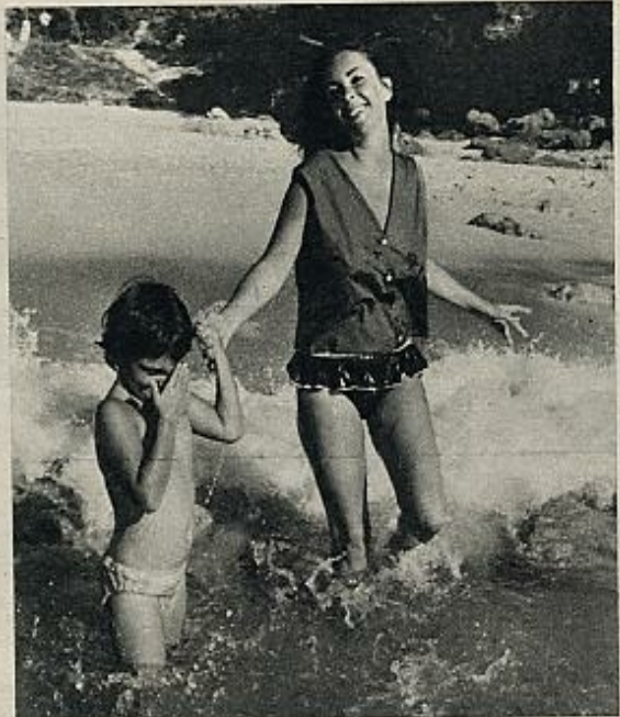
Mientras Burton rueda los exteriores de «La noche de Iguana», Liz Taylor ha adquirido un apartamento en Gringo Gulch, cerca de la playa de Puerto Vallarta. Aprovechando el excelente clima mejicano, bueno ahora para prolongar las vacaciones, la estrella pasa allí las horas con su hija Liza, nacida del matrimonio con Michael Todd.