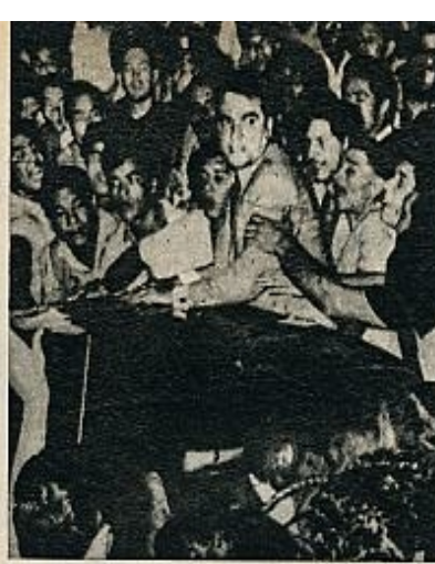
El regreso triunfal a Caracas del vicealmirante Larrazábal, después del «exilio dorado» en Chile.