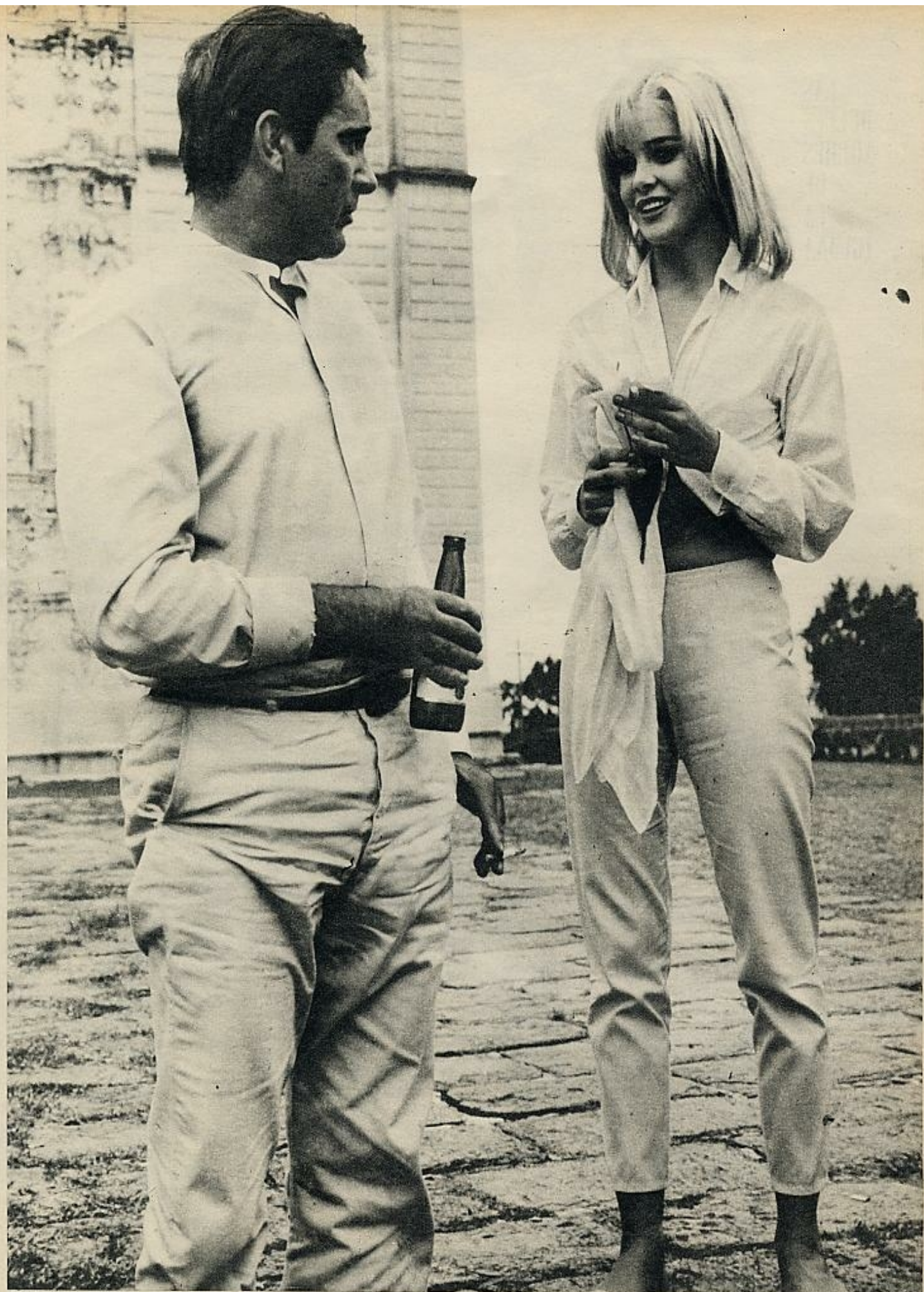
UNA ESTRELLA RECIEN NACIDA Y OTRA TOTALMENTE SITUADA. SUE LYON Y LIZ TAYLOR CONVERSAN CON RICHARD BURTON. EL ACTOR INGLES ERA HASTA AHORA FUE CONOCIDO, PUES POR AQUELLA EPOCA TAMBIEN SE PROYECTABA OTRA SUYA, «MI PRIMA RACHEL». LA POPULARIDAD MUNDIAL LE HA VENIDO A BURTON GRACIAS PRONTO, LIZ, QUE ULTIMAMENTE NO SE SEPARA DE EL, HA ACUDIDO A MEJICO PARA ACOMPAÑAR A BURTON DURANTE EL RODAJE DE «LA NOCHE DE LA IGUANA».