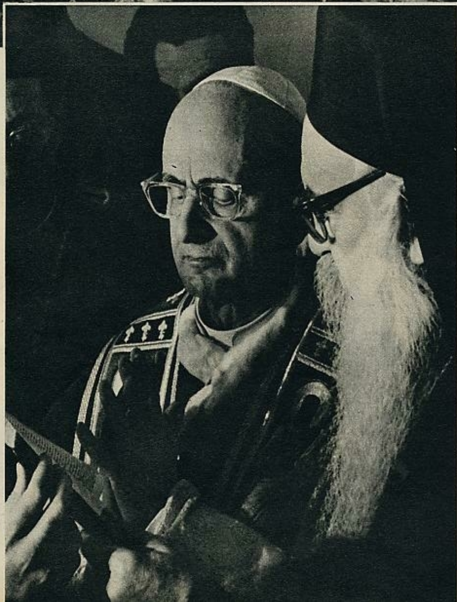
Pablo VI en la gruta donde nació Jesús. El Papa ofició una misa en la iglesia de la Natividad y oró en la gruta. Después, al encontrarse con el patriarca Atenágoras, rezó, junto con él, un Padrenuestro.

Con esto se ha dado un paso hacia la unión de los cristianos más grande que cualquier otra declaración.