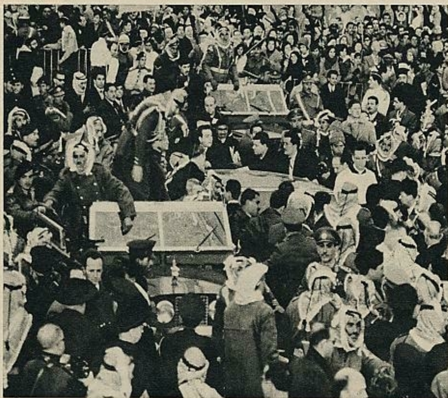
En las riberas del Jordán, donde fuera bautizado Cristo, cerca del puente de Abdullah. Después de orar durante unos momentos, el Papa se volvió a la multitud y la bendijo. El helicóptero del rey Hussein sobrevolaba la escena. Fue éste, sin duda, uno de los instantes de la peregrinación de más intensa emoción.