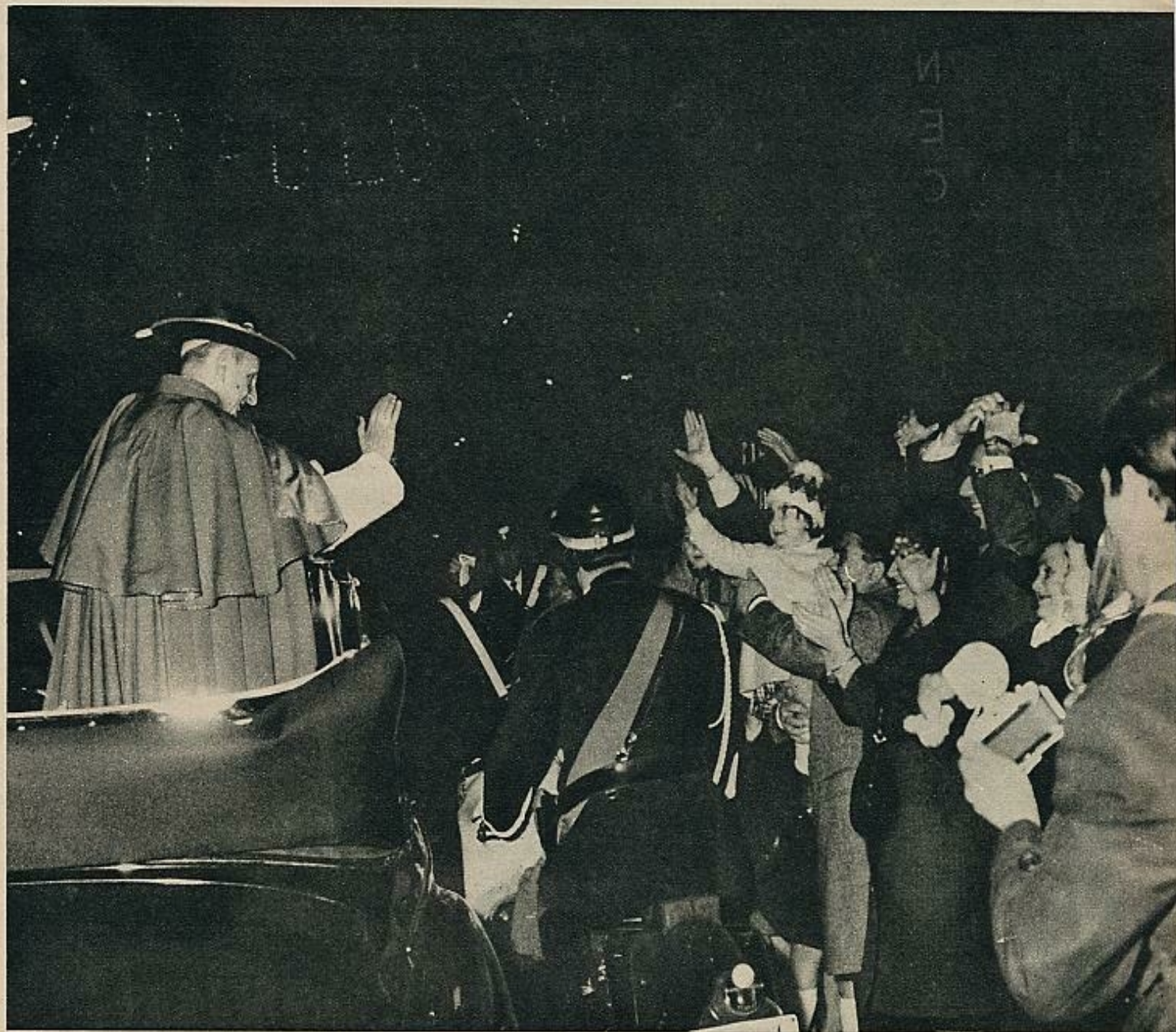
El regreso a Roma, entre aplausos y vítores. El Papa hizo de pie, en su coche, el recorrido hasta el Vaticano. En el aeropuerto había sido acogido por el Presidente de la República y el Gobierno italiano en pleno. Luego, desde una ventana de sus habitaciones, el Pontífice saludó a la multitud.