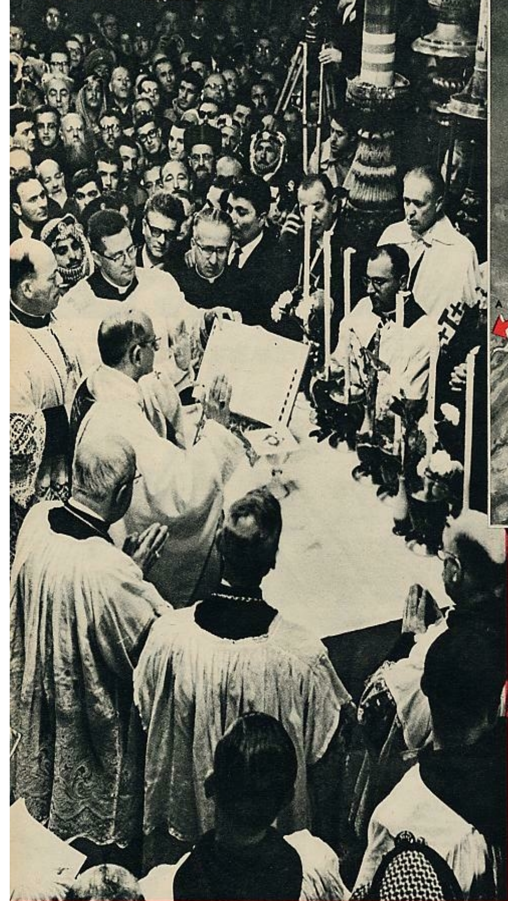
En la puerta de Damasco, el Papa descendió de su coche para realizar a pie el camino de la Cruz hasta la iglesia del Santo Sepulcro, totalmente repleta de fieles. Después celebró la misa sobre un altar de madera.