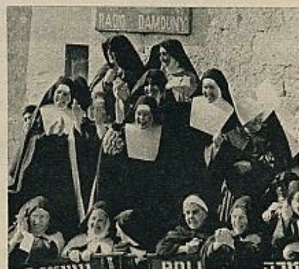
El Papa hizo una entrada triunfal en Belén. Una multitud de niños arrojó flores a su paso. En la foto, vemos cómo le aclama un grupo de sonrientes monjas.