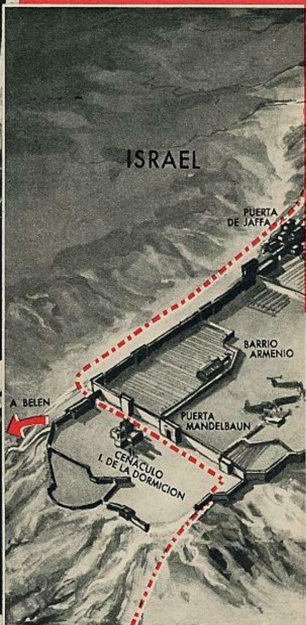
Una interpretación panorámica de la ciudad de Jerusalén.

tía». Y para eso tenemos que estimular el desarrollo de todos los hombres y la promoción de todos los necesitados, pueblos o individuos.