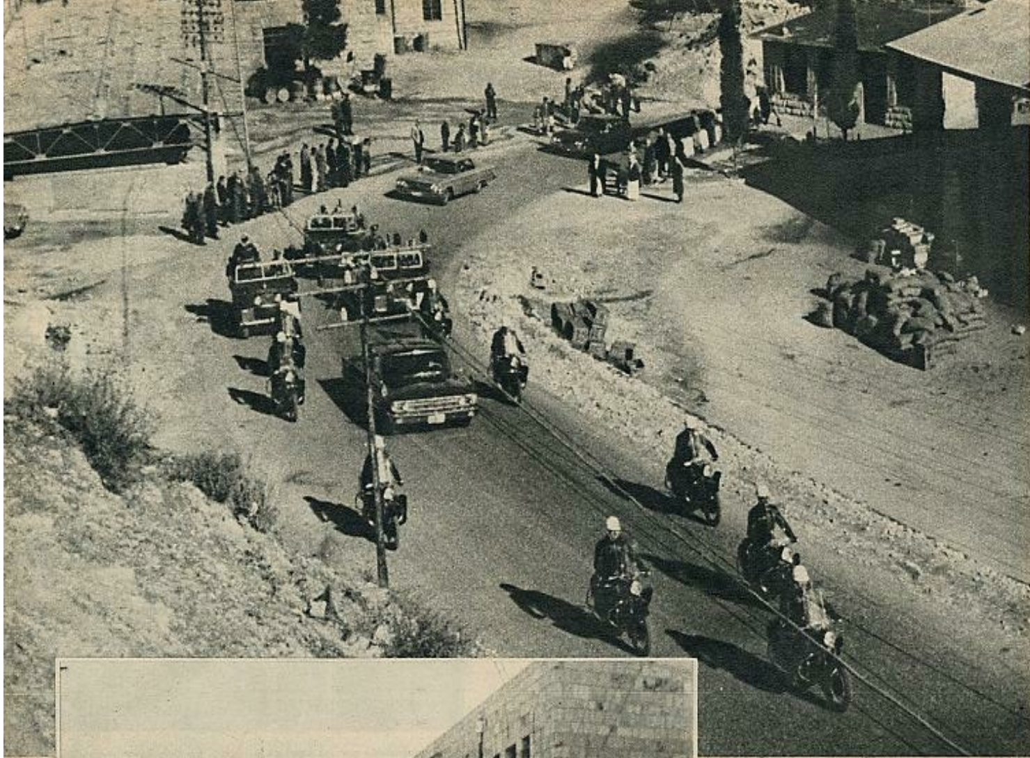
Ultima jornada del Papa peregrino en Tierra Santa. Su automóvil, escoltado por los «jeeps» de la Legión Árabe, al hacer su entrada en Belén, donde, según sus palabras, pediría «para todos los hombres el don de una paz verdadera y durable».