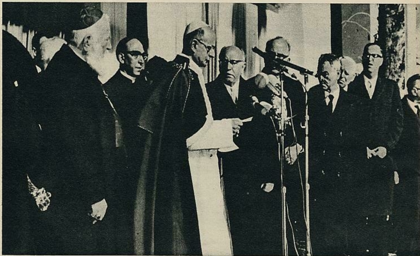
En el mar de Galilea, el Pontífice recoge un poco de agua en sus manos. Es la suya una peregrinación inolvidable por los caminos de Jesús. En Cafarnaum —abajo, a la derecha— contempla los vestigios de la sinagoga. Arriba, Pablo VI en el momento en que es recibido al entrar en Israel, por el Presidente Salman Shazar.

religioso jesuita, inteligente teólogo, y que, al final de su vida, renunció al cardenalato. Se llamaba el cardenal Billot. Siempre fue su divisa la sinceridad y la modestia; como lo fue, en otra figura intelectual muy distinta, el gran Papa Juan XXIII.