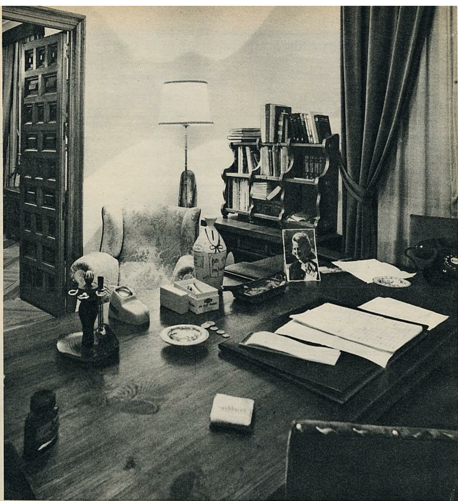
El cuarto de trabajo de Carlos Hugo de Borbón-Parma en su residencia madrileña de la calle de Hermanos Becquer. Es licenciado en Derecho por la Sorbona, y en Ciencias Económicas por Oxford. Habla a la perfección el inglés, francés, alemán, italiano y portugués. Sobre su mesa de trabajo, una foto de su prometida, la princesa Irene.

momento muy a favor del marqués de las Claras; había varios argumentos: hablaba perfectamente el holandés, conocía muy bien los Países Bajos, se le había visto acompañado en alguna ocasión de la princesa... Pero, en realidad, nada autorizaba a dar este pretendiente como seguro. Las especulaciones continuaban, el misterio se mantenía.