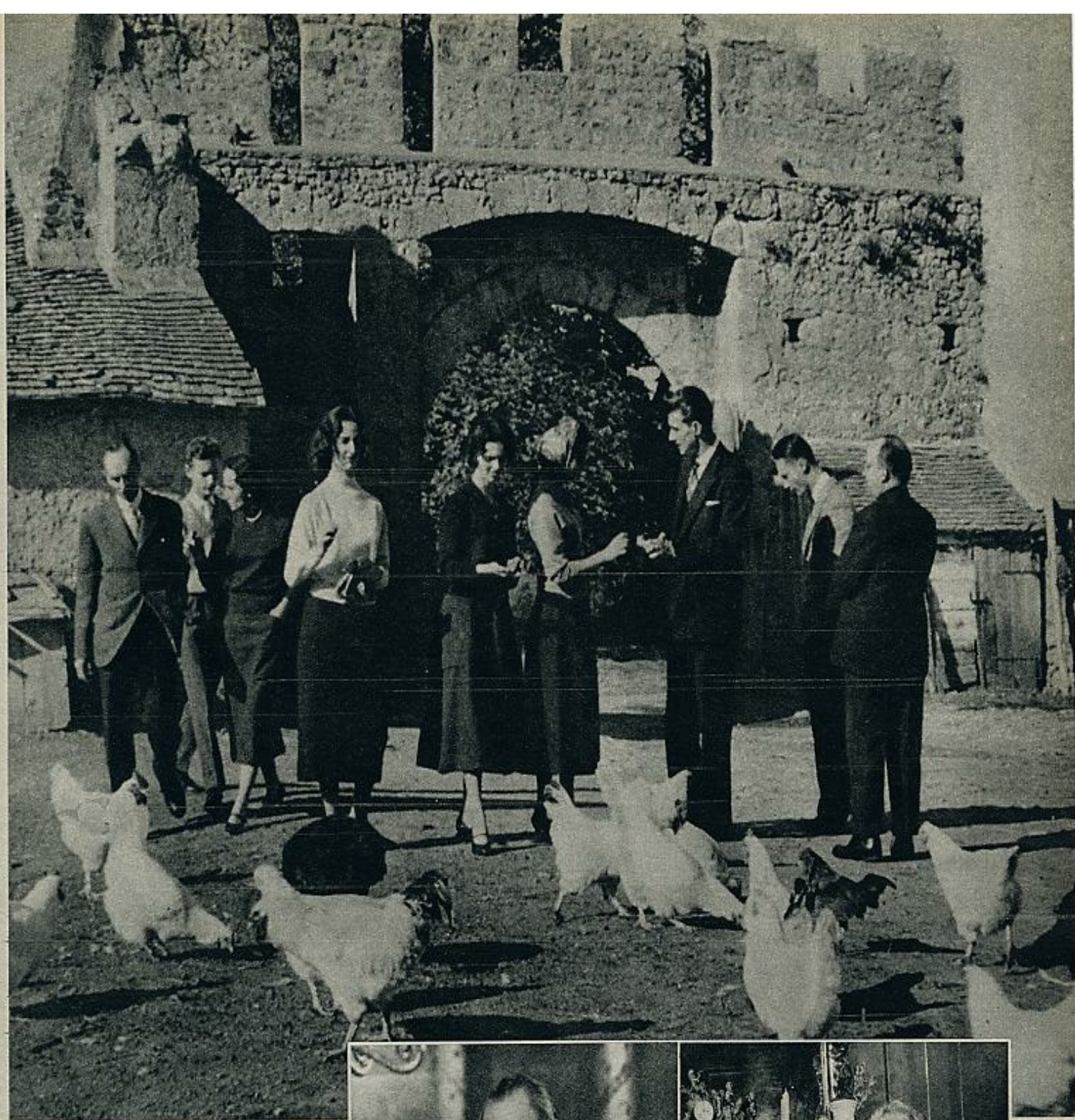
Foto superior: en el patio del castillo de Lignéres, las princesas, hermanas de Carlos Hugo, se entretienen en echar el grano a las gallinas. A la derecha, el príncipe Javier con uniforme de teniente general de la Orden del Santo Sepulcro, y la princesa Magdalena que, por su nacimiento, es Borbón-Busset.

de su cuna, estuvo durante un mes trabajando bajo nombre supuesto en una mina asturiana, en julio de 1962, hasta que fue descubierta su personalidad. Entre sus aficiones destaca especialmente la aviación, estando en posesión del título de Piloto Privado español. El pasado año realizó el curso de Paracaidismo Deportivo, obteniendo en Sevilla el título internacional, en el que batió el record con 26 saltos consecutivos. Siente pasión por la música, el teatro y los deportes, practicando regularmente la natación, el tenis y el esquí.