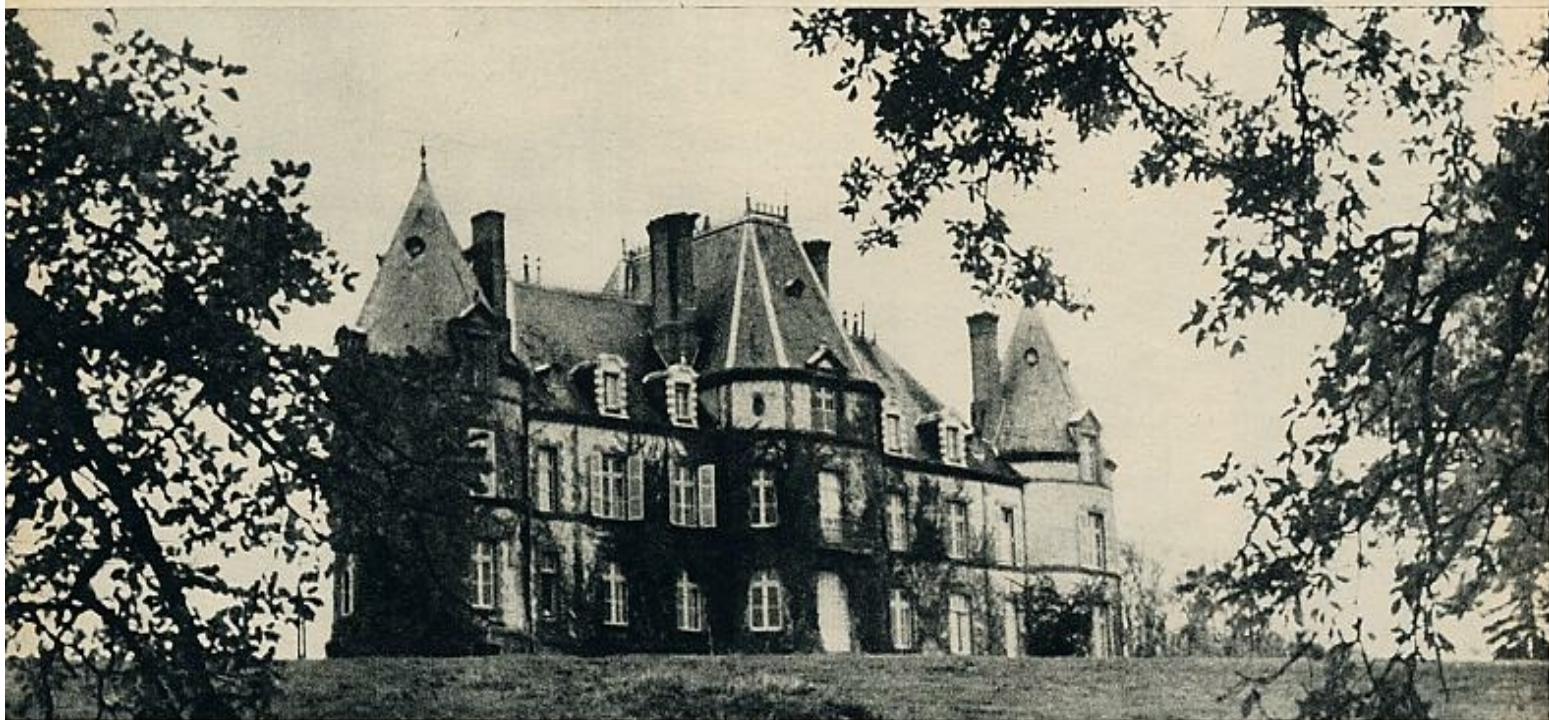
Sobre estas líneas, el castillo de Lignières, en Francia, residencia de la familia Borbón-Parma. En la foto inferior, toda la familia reunida alrededor de los padres. De izquierda a derecha: las princesas María Teresa, María de las Nieves, Francisca, casada con el príncipe Eduardo de Lobkowitz, el príncipe Sixto, la condesa de Borbón Busset (sentada), hermana de la princesa Magdalena, el príncipe Carlos Hugo y la princesa Cecilia. Esta fotografía data de hace varios años.