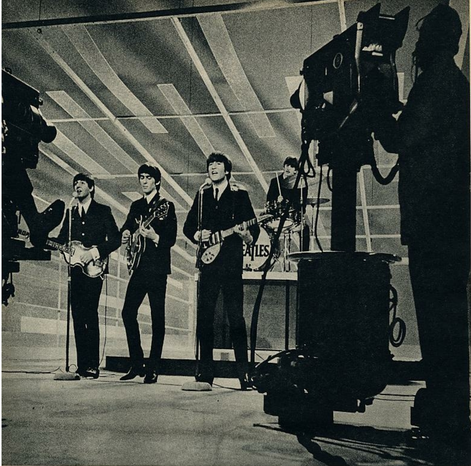
George, Paul, John y, con la batería, Ringo, el último que se ha incorporado al grupo de los «Beatles». En la foto, un momento de su actuación ante la TV norteamericana. Gracias a ella, los cuatro muchachos de Liverpool han alcanzado una difusión verdaderamente mayoritaria y, hoy día, es el conjunto más famoso del mundo.

G EORGE, Paul, Ringo y John, ahora en los Estados Unidos, siguen comportándose como verdaderos «beatles»: han batido todos los records de popularidad imaginables. Primero fue el recibimiento, que congregó en el aeropuerto de Nueva York a miles de «fans» dispuestos a ver a sus ídolos en carne y hueso y luego, durante su actuación en la TV, gracias a la cual, varios millones de americanos pudieron verles y escucharles. «The Beatles» se ha convertido, indiscutiblemente, en el conjunto musical más popular del momento. Su ascenso ha sido ver-