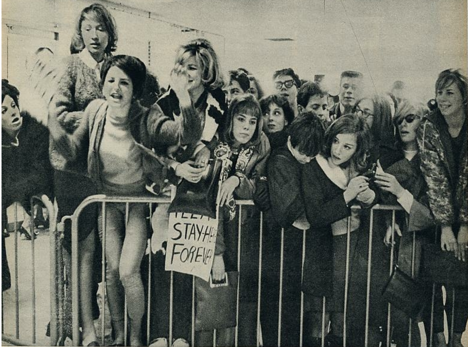
las verdaderas estrellas. Con un tinglado publicitario muy bien montado, los «Beatles» han conseguido atraer la atención de millones de aficionados en todo el mundo.

les» y los jerseys con las efigies de los cuatro muchachos. Evidentemente, con esta venta masiva de pelucas y jerseys, aparte de obtener unos saneados ingresos suplementarios, han puesto en pie un concepto de la publicidad muy vivo y de indudable eficacia sobre el público.