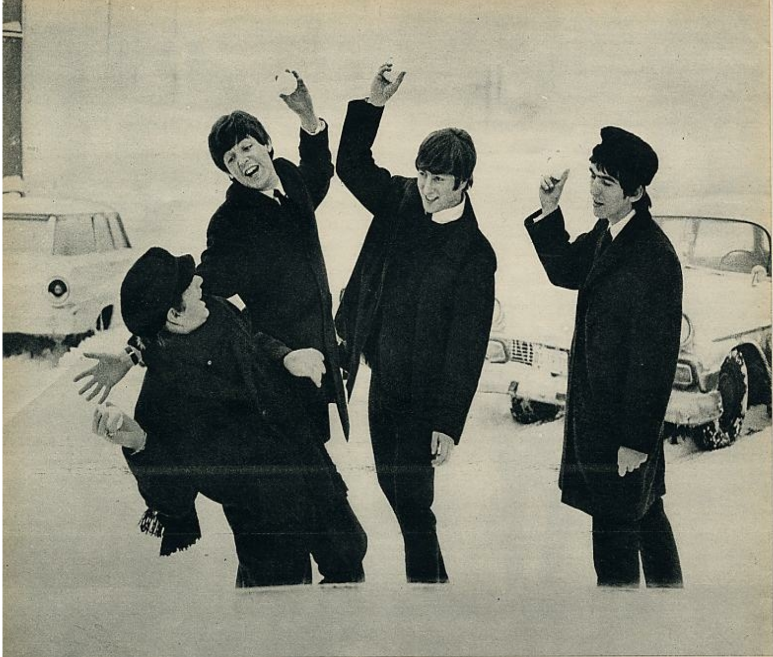
El fenómeno «Beatles» ha sacudido el mundo durante estas últimas semanas: de Liverpool a los Estados Unidos, estos muchachos han recorrido el itinerario obligado de