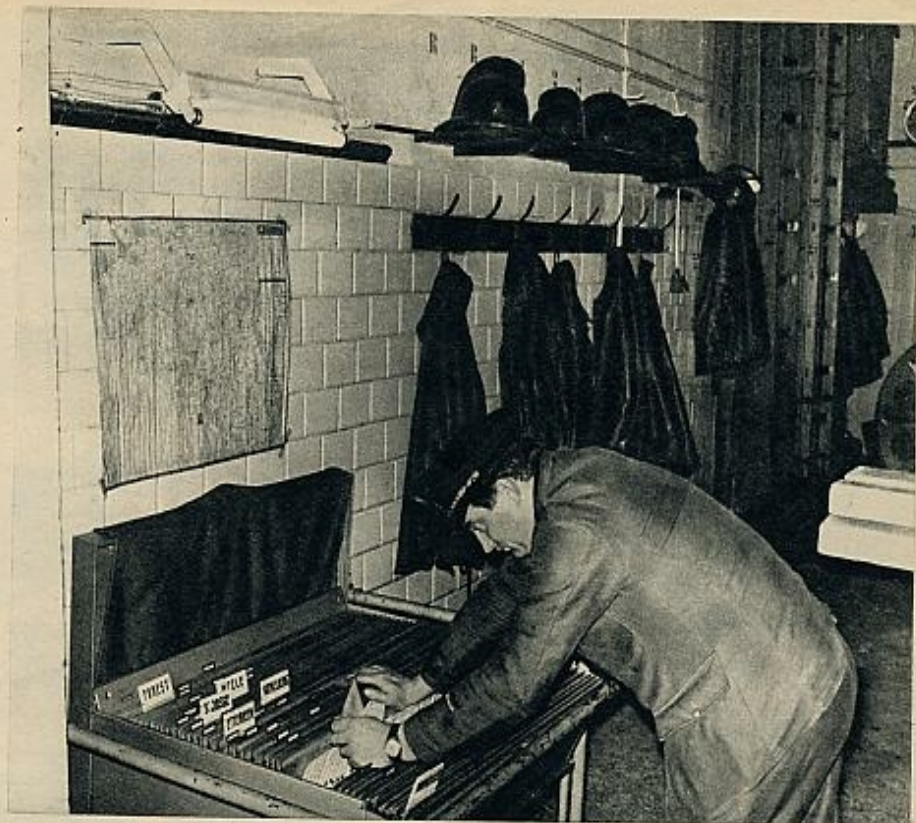
Los altavoces anuncian la dirección donde ha ocurrido el accidente. Un empleado busca en el archivador (arriba) el itinerario que permita llegar con más celeridad al lugar del hecho. Una señora se ha sentido indispuesta cuando circulaba por la calle. Avisada por el «900» llega una ambulancia que la recoge (abajo).

En cualquier ciudad, pueblo o villorrio de Bélgica basta marcar el número 900 e, inmediatamente, una de las diecisiete centrales se encarga del caso, transmitiéndolo al coche-patrulla de bomberos, a la Cruz Roja o al servicio de auxi-