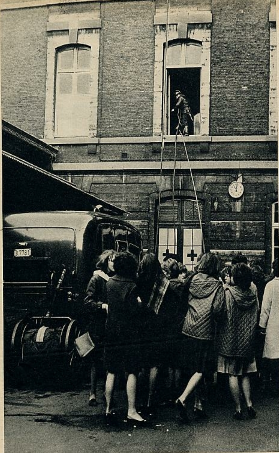
El suceso ha sobrevenido en un colegio durante las horas de clase. Los bomberos entran rápidamente en acción, mientras las escolares presencian con gran curiosidad sus rápidos y precisos movimientos.

lio más próximo a la zona de la que proviene la llamada. Pero si el que efectuase la llamada no pudiese dar todos los datos necesarios, los servicios de auxilio se encargarían de localizarle inmediatamente, ya que al descolgar el teléfono en la central se registra automáticamente el número del teléfono del comunicante y, en consecuencia, puede averiguarse el origen de la llamada.