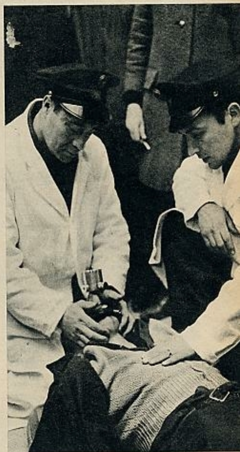
En este caso, la llamada se debió a un caso de asfixia en un pequeño taller. Los servicios de emergencia, avisados por medio del «900», llegaron con el tiempo justo para reanimar al accidentado.

Mensualmente, el servicio 900 responde a más de 1.200 llamadas de socorro «serias» sólo por accidentes de circulación urbana. Inevitablemente hay llamadas «no serias»: los hay despistados que llaman al 900 para pedir un taxi o cualquier información, como si se dirigiesen a una central telefónica cualquiera. A estos no se les hace caso.