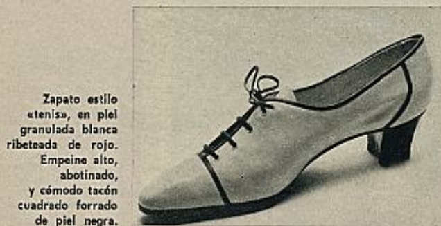
Zapato estilo «tenis», en piel granulada blanca ribeteada de rojo. Empeine alto, abotinado, y cómodo tacón cuadrado forrado de piel negra.