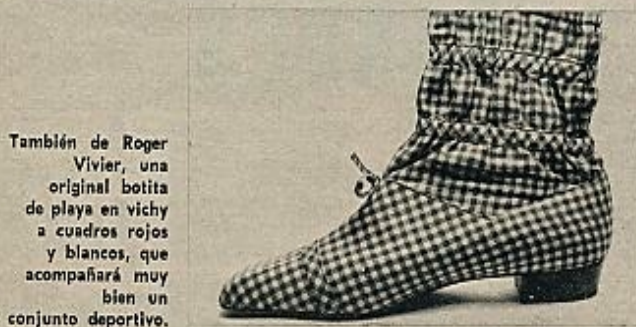
También de Roger Vivier, una original botita de playa en vichy a cuadros rojos y blancos, que acompañará muy bien un conjunto deportivo.