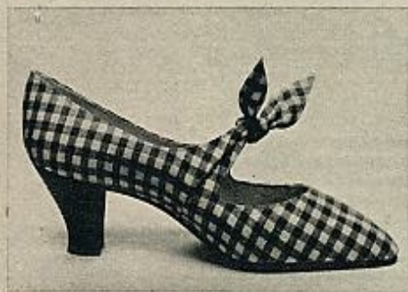
Roger Vivier, el gran creador de zapatos parisino, presenta este modelo de vichy a cuadros azules y blancos, con tacón de suela de 4 centímetros.

La característica de estos modelos es el tacón de cuatro o cinco centímetros, cuadrado y, a menudo, de suela; el empeine bastante alto, y la punta ligeramente redondeada. Y una novedad: la bota de playa, de vichy, con tacón plano, para acompañar los pantalones.